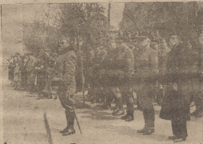
EL GENERAL SALIQUET PRESENCIANDO EL DESFILE CELEBRADO EN EL PASEO DEL PRADO DE MADRID EL DOMINGO ULTIMO