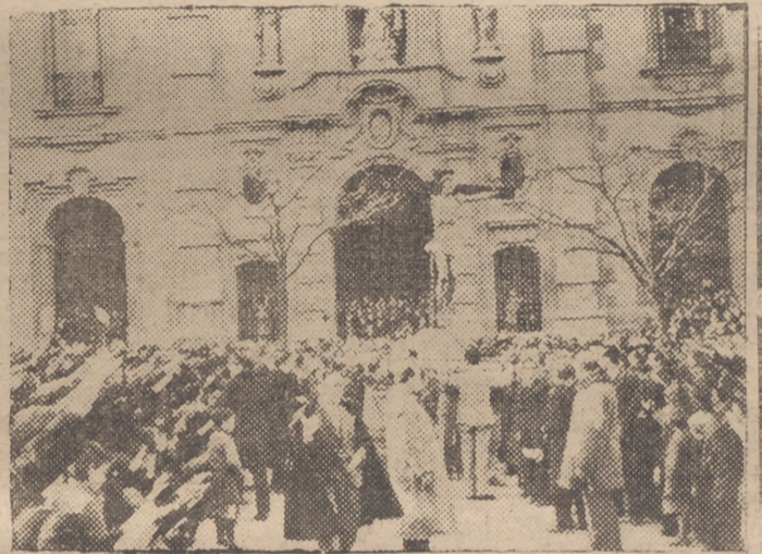
En la tarde del Viernes Santo un solemnisimo Via Crucis ha recorrido las principales Calles de Madrid. La manifestación religiosa, primera de las celebradas, después de la liberación de la capital, ha sido presidida por el Obispo de Madrid-Alcalá, Dr. Eijo, y a ella se sumó todo el pueblo madrileño. Momento de salir de la iglesia de San José la imagen de Jesús Sacrificado, mutilada por los rojos.