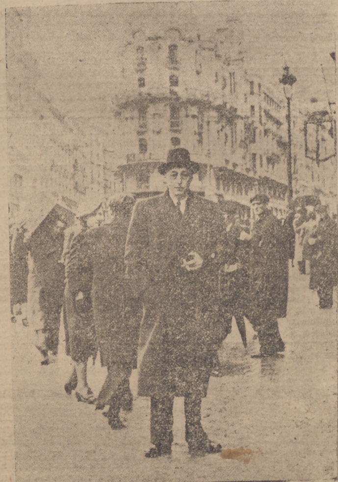
El ministro de Justicia, conde de Rodczno, durante su visita a Madrid, paseando por la calle de Alcalá