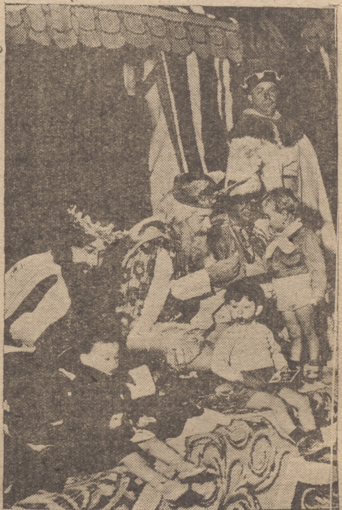
Melchor, Gaspar y Baltasar, en la recepción dispensada ayer a los niños malagueños