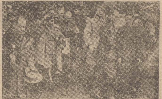
BOINAS ROJAS, que, por falta de materias para la confección de fotogramas, ha tenido suspendida su información gráfica varios días, se honra recogiendo hoy un momento de la visita del CAUDILLO a Santiago de Compostela, cuando el GENERALISIMO FRANCO salía de la Catedral