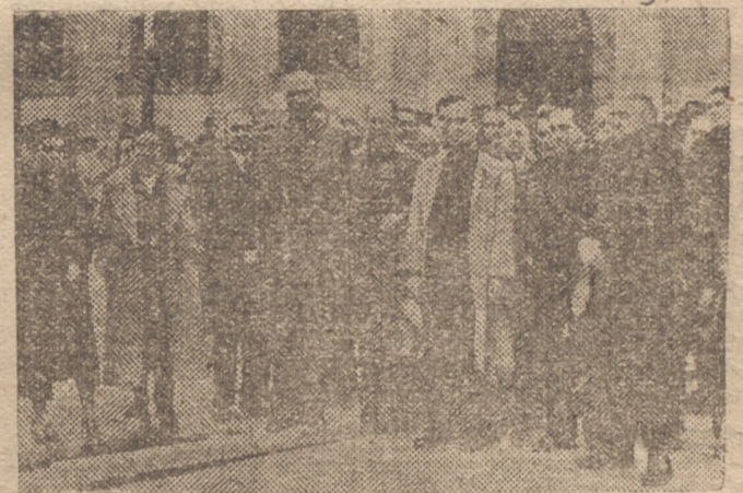
El general Queipo de Llano, el Gobernador civil y Jefe provincial Eduardo Cadenas; el Alcalde, camarada Joaquín Benjumca, y otras autoridades, en el acto de la bendición de las obras del Tiro de Línea, en Sevilla