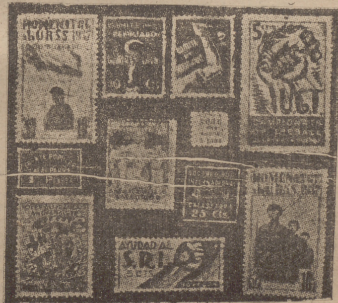
Todo el servilismo a Moscú, expresado en una emisión de sellos oficiales en la «zona leal», como homenaje a la U. R. S. S.