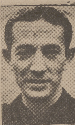
Camarada Dionisio Ridruejo, Consejero Nacional

(Información en las páginas 6, 7, 9 y 10).