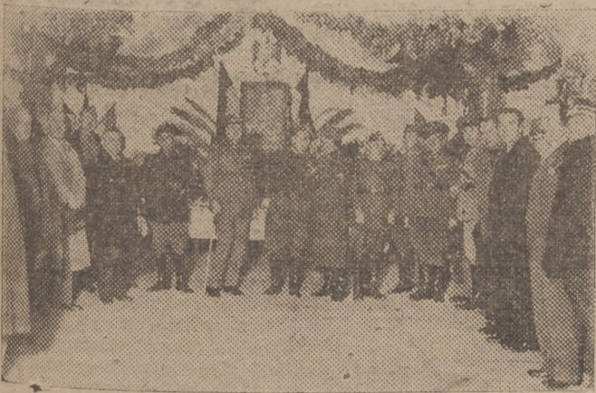
El Escribano, señor Gobernador Militar y un grupo de invitados al vino que en honor de la autoridad militar dieron los criadores y exportadores de vinos de Málaga con motivo del donativo que hicieron para los heroicos soldados