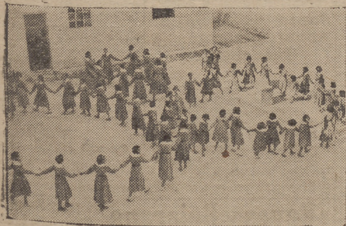
Las niñas acogidas en las Carmelitas del Limonar realizan ejercicios físicos en el patio del Centro

En combates aéreos fueron derribados ayer 18 aviones rojos