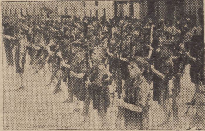
Los huérfanos de guerra del Colegio de San Bartolomé esperan la voz de mando para ejecutar el movimiento prciso