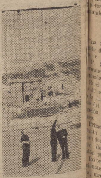
Observando la instalación de antenas del equipo de radio

De Las Carmelitas, de este rincón delicioso de El Limonar pasamos a la Casa Cuna, cuyo proyecto se debe al arquitecto señor Jáuregui Briaies. Recordemos las reformas últimas del edificio, que evidencian los deseos