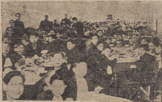
Una vista del comedor de San Bartolomé, donde se expande el entusiasmo jubiloso de esa disciplinada infancia

Recorremos las clases, salones luminosos, con un material adecuado. Estos niños no han concei-