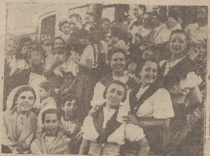
Un grupo de muchachas de las Organizaciones Juveniles, durante el acto inaugural del Campamento de Flechas Femeninas, celebrado en la tarde de ayer en las cercanías de Torremolinos