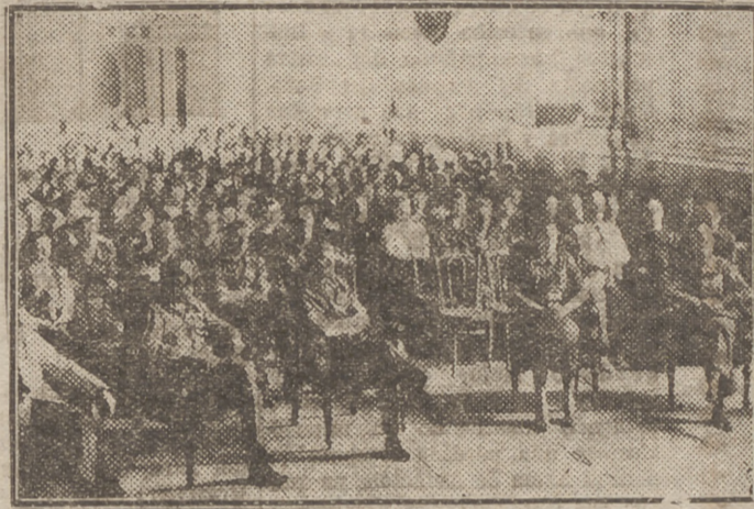
Aspecto del Salón de actos del Conservatorio de María Cristina, durante la magnífica disertación que, en la tarde de ayer, hizo ante la Falange de Málaga, el R. P. Fray Justo Pérez de Urbel, sobre el lema "Patria, Pan y Justicia."

España—continúa—es un pueblo de realismo fuerte, crudo y espiritual al mismo tiempo. Un pueblo de monjes y soldados, España Quijote, la de las grandes empresas! Pero no una España ni una Patria con un Santo, nuestra historia, y dentro de