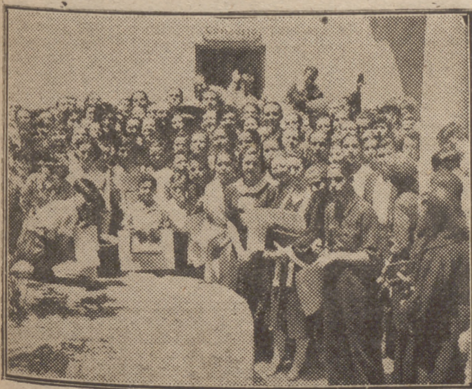
Autoridades, profesores y alumnos del cursillo de lengua italiana, después del reparto de premios, verificado el domingo