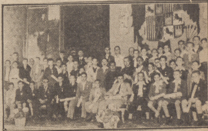
Alumnos del Colegio de los RR. PP. Jesuitas de Miraflores de El Paño que obtuvieron dignidades en la fiesta de fin de curso