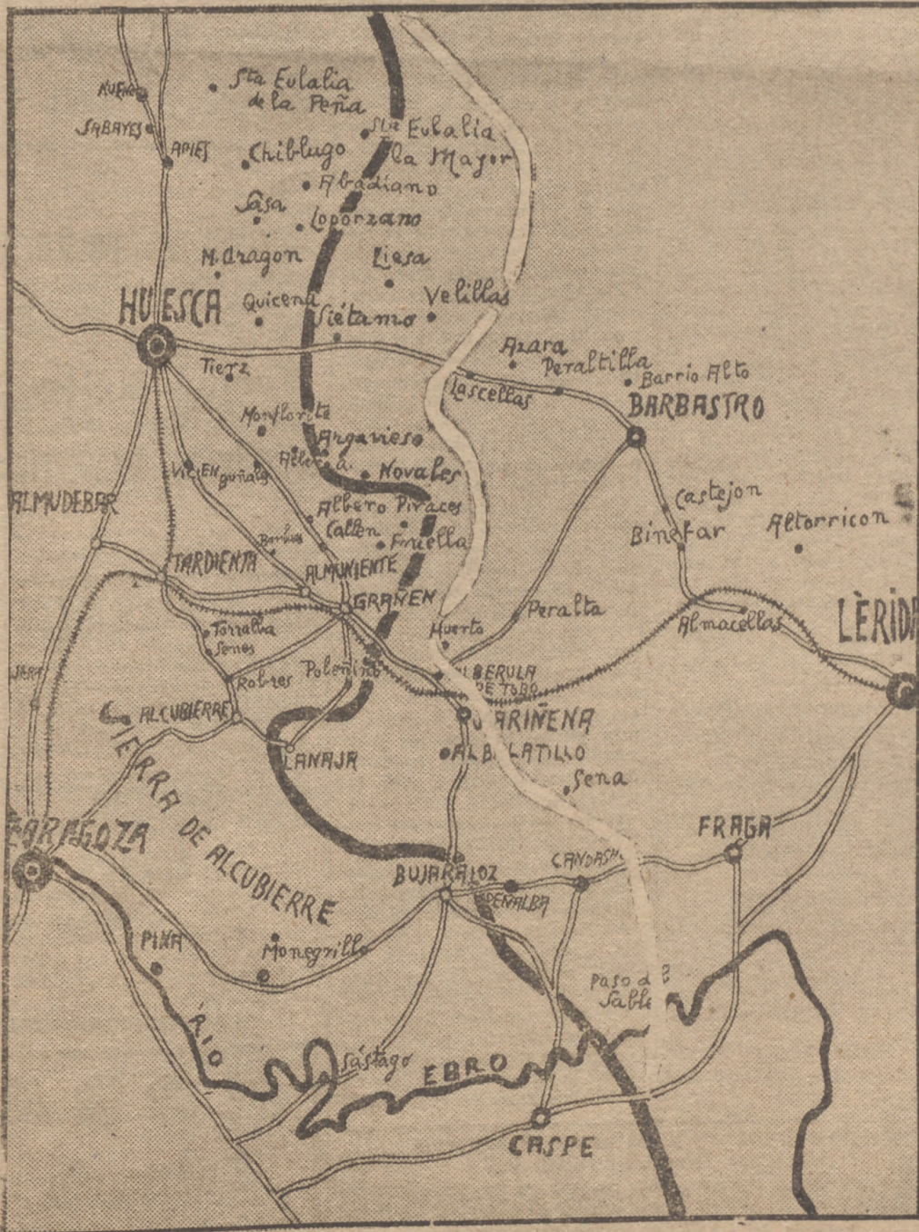
LA LINEA NEGRA SEÑALA EL AVANCE DE ANTEAYER. LA LINEA BLANCA INDICA EL ESTADO EN QUE QUEDARON AYER LAS LINEAS DE ESPUES DEL VICTORIOSO AVANCE DE NUESTRAS FUERZAS

En la región al norte de Los Monegros se han ocupado Sesa, Salilla, El Pullalón, Uzon, La Zanda, alturas que dominan Albernuela de Toba, Poleñino, Lalusa, Lanaja, Farlete, Monegrillo, Sariñena y alturas de Castan de Monegros. Se ha rebasado Alcuibierre por el sur en tres kilóme-