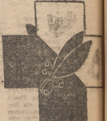
Asistencia a Frentes y Hospitales