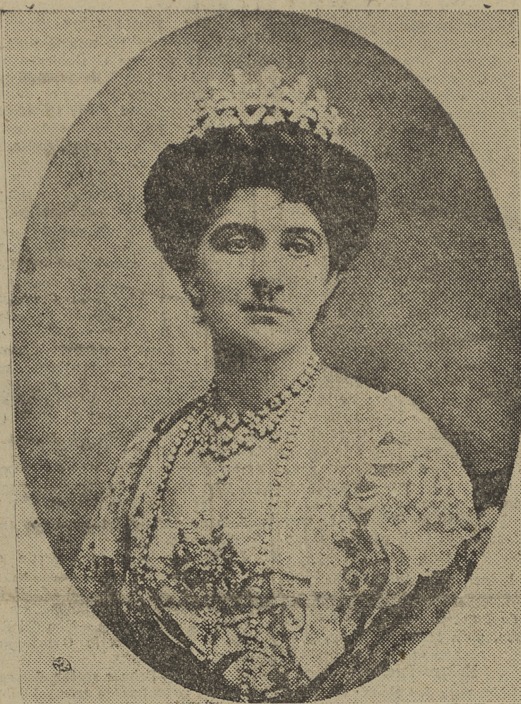
La Reina y Emperatriz de Italia, Elena de Montenegro