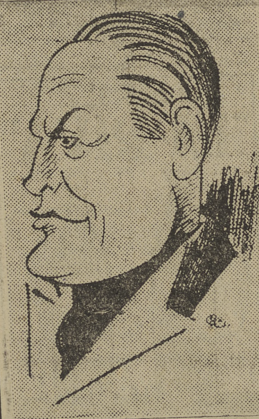
Una vez más adquiere actualidad sobresaliente la figura del Duce, cuya presencia animará las grandes fiestas conmemorativas de la marcha sobre Roma, que dan comienzo hoy

ROMA, 28.—Hoy, con motivo de celebrarse el XV aniversario de la marcha sobre Roma tendrán lugar grandes actos. Ante 100.000 jóvenes del Partido Nacional Fascista el Duce, en el Foro Mussolini, echará la primera pala en el lugar donde debe construirse la Casa Histórica del Partido. Ante el Duce realizarán ejercicios 12.000 jóvenes fascistas. Asistirán representantes del Führer y un ministro del Reich. Serán inauguradas 445 obras de saneamiento, en las que se emplearán 333.299.554 liras que aseguran más de 8.696.612 jornales de obreros.