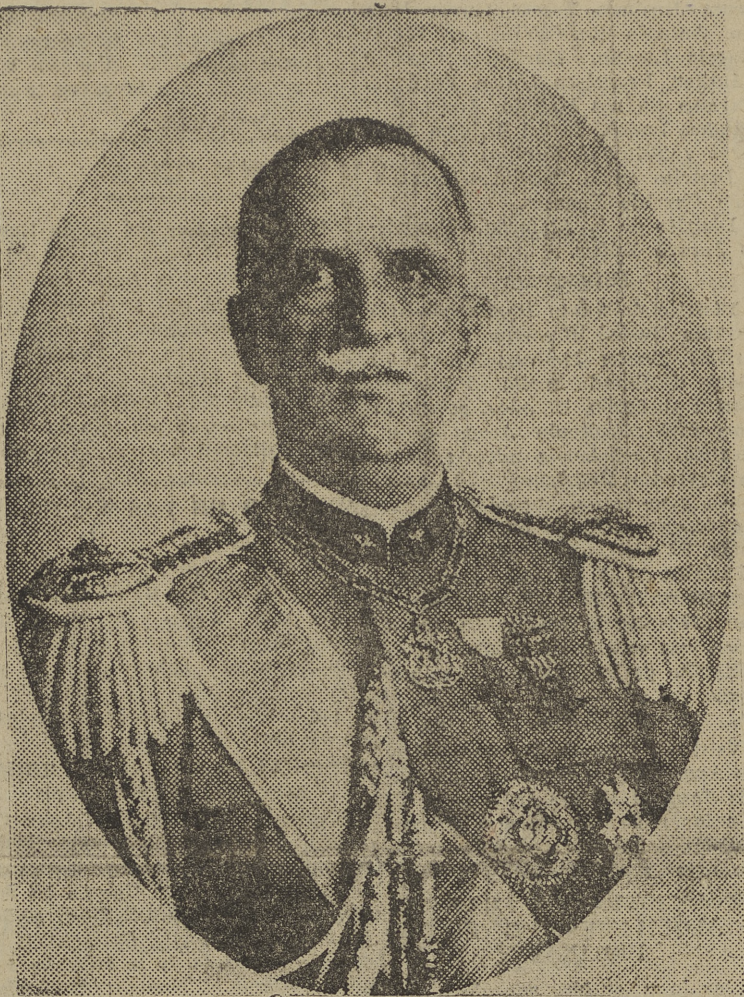
Victor Manuel III, Rey de Italia y Emperador de Abisinia