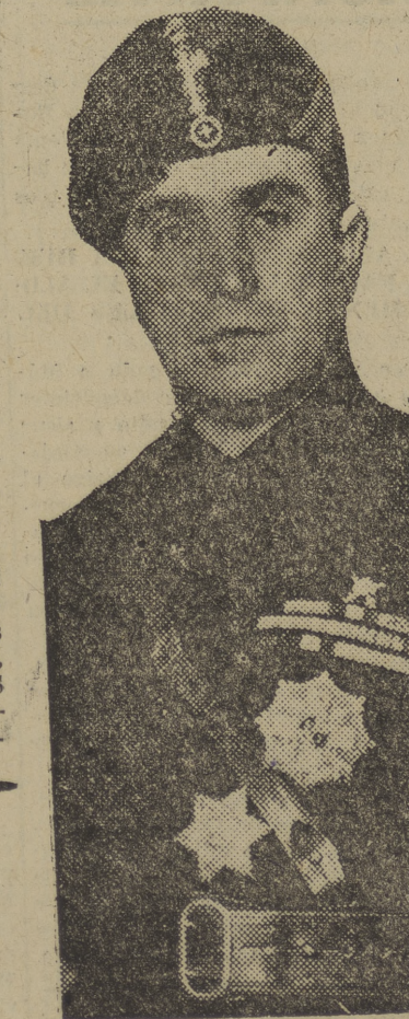
Don Tranquillo Biadelli, Cónsul de Italia en Málaga, que tan meritorios servicios lleva prestados en pro de la amistad italo-española y que por sus cualidades personales goza de merecida popularidad entre los malagueños