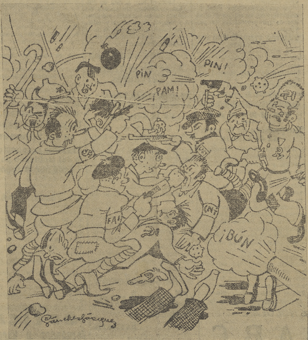
BARCELONA ES "BONA" SI LAS PISTOLAS "SONAN"

a las tres de la tarde, el edificio de la Generalidad, del cual se han apoderado.