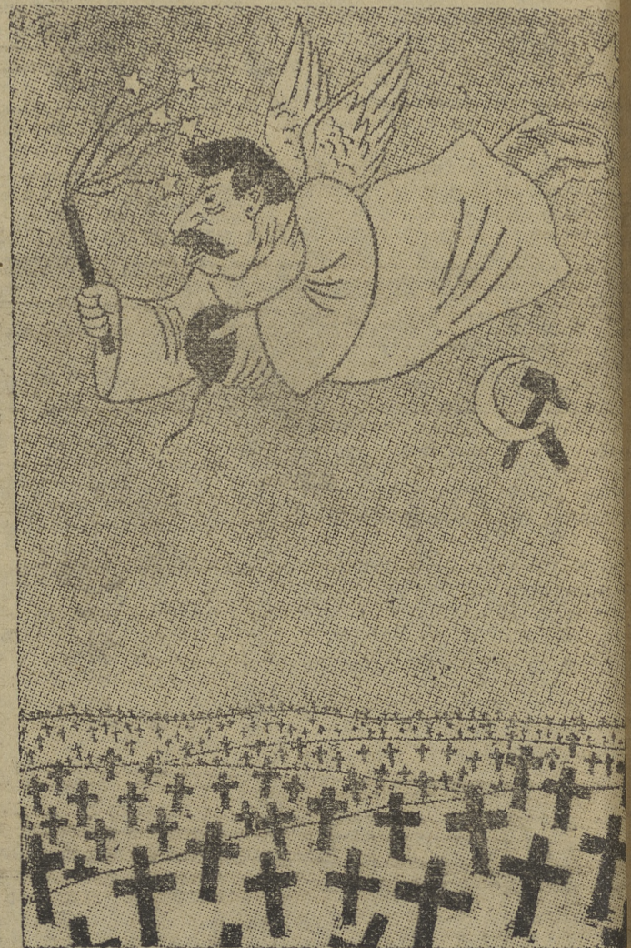
EL NUEVO MENSAJERO DE LA PAZ... El mensaje de Stalin brota encopiosa sembrera.