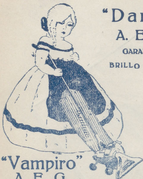
"Vampiro" A. E. G. LIMPIA TODO SIN TRABAJO ALGUNO

"Dandy" A. E. G. GARANTIZA BRILLO ESPEJO