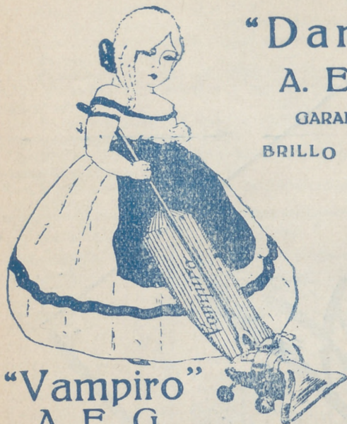
"Vampiro" A. E. G. LIMPIA TODO SIN TRABAJO ALGUNO.