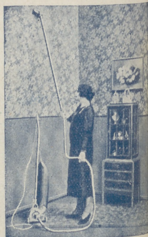
“Dandy” A. E. G. GARANTIZA BRILLO ESPEJO