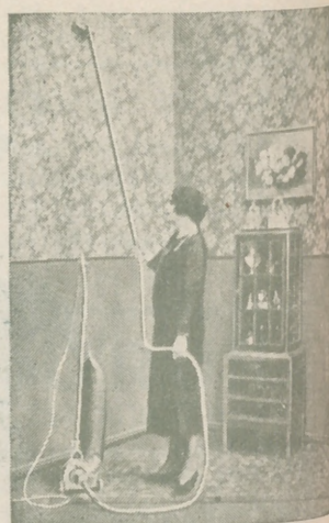
“Dandy” A. E. G. GARANTIZA BRILLO ESPEJO.