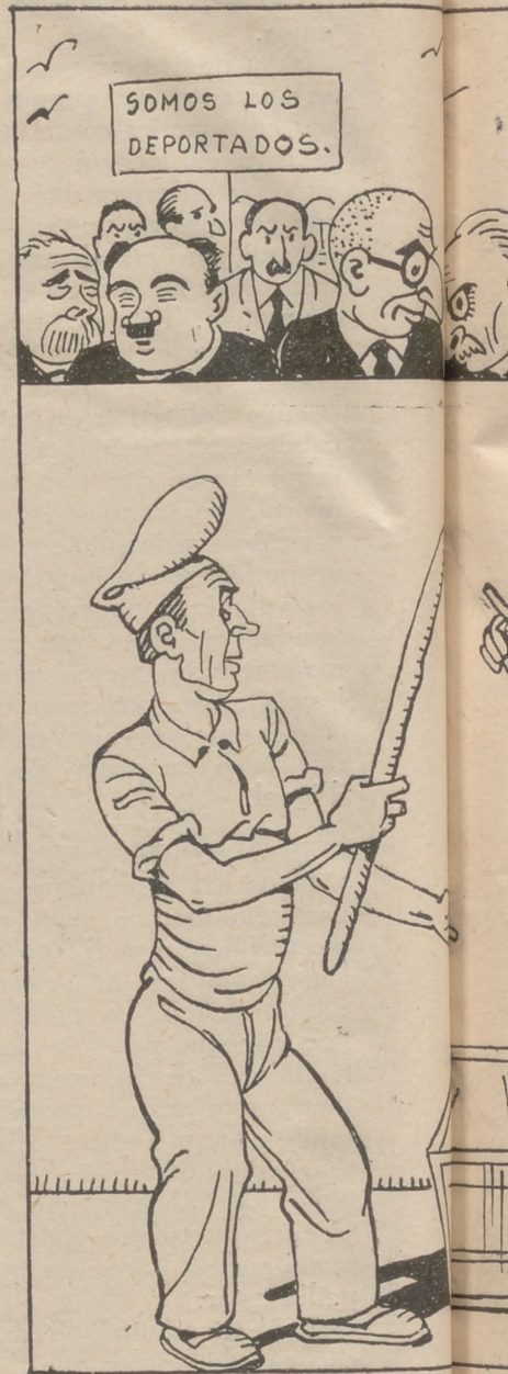
—Prepararé el vot. Però no este mé

¿Et recordes, ciutadà, de la ineficàcia pràctica del catalanisme mentre aquest ha estat mediatitzat per la Lliga? El poble sentia, malgrat tot, el catalanisme, però els polítics regionalistes hi mercadejaven. Els servia per