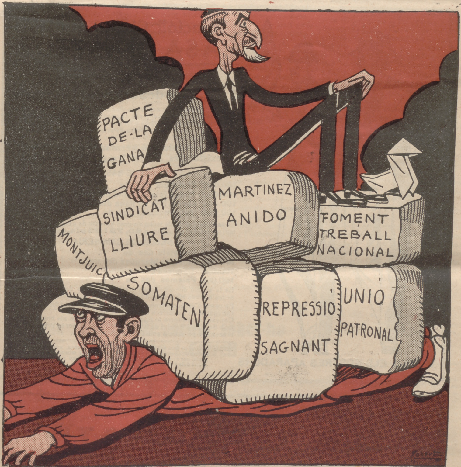
—Sí senyors, sí. «La Lliga sempre ha vetllat pel benestar de la classe obrera.»