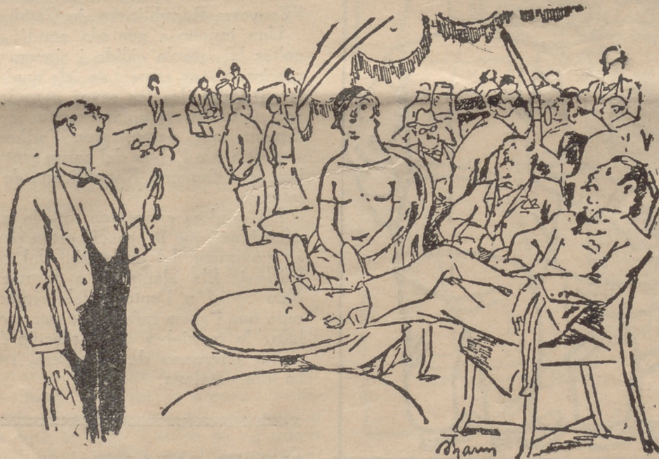
El cambrer servicial:

«Sellos antigripales de San Antonio —tiene usted la grippe porque quiere. —Los sellos antigripales San Antonio curan la grippe, resfriados y troncazos