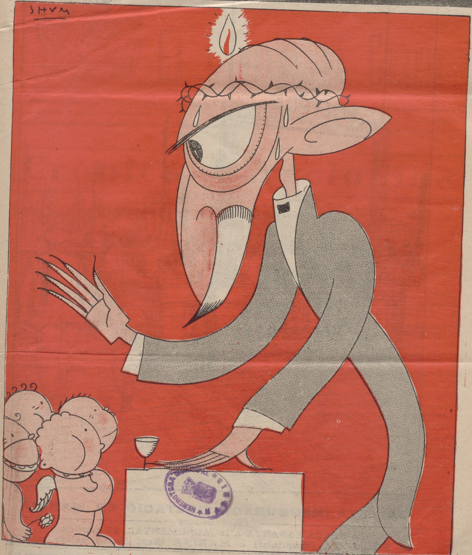
Cambó ha parlat a les Joventuts de la Lliga.