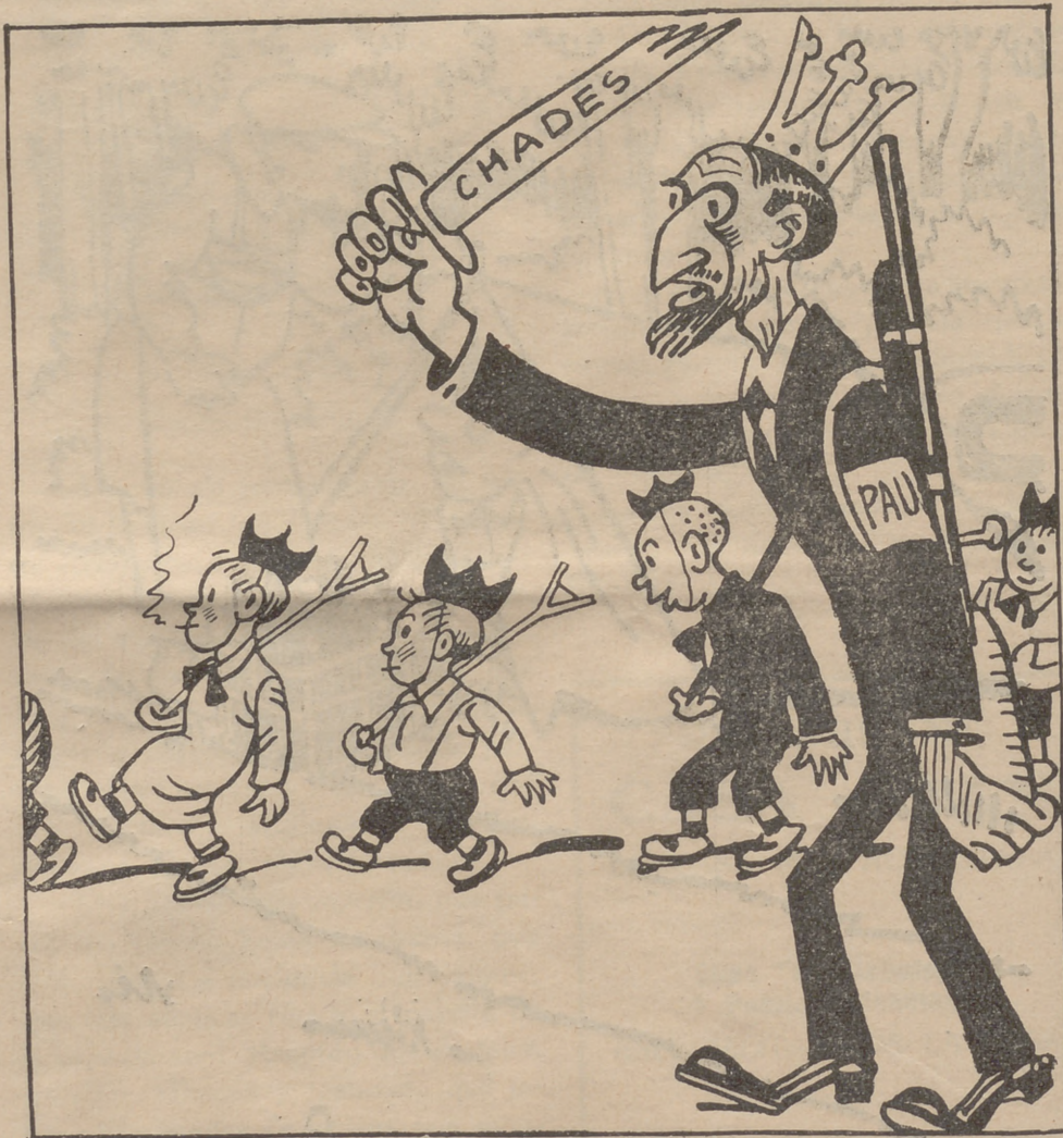
Les joventuts de la Lliga

L'exèrcit d'en Francisquet que ha de salvar Catalunya.