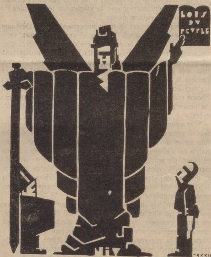
Les lleis han d'ésser iguals per a tots