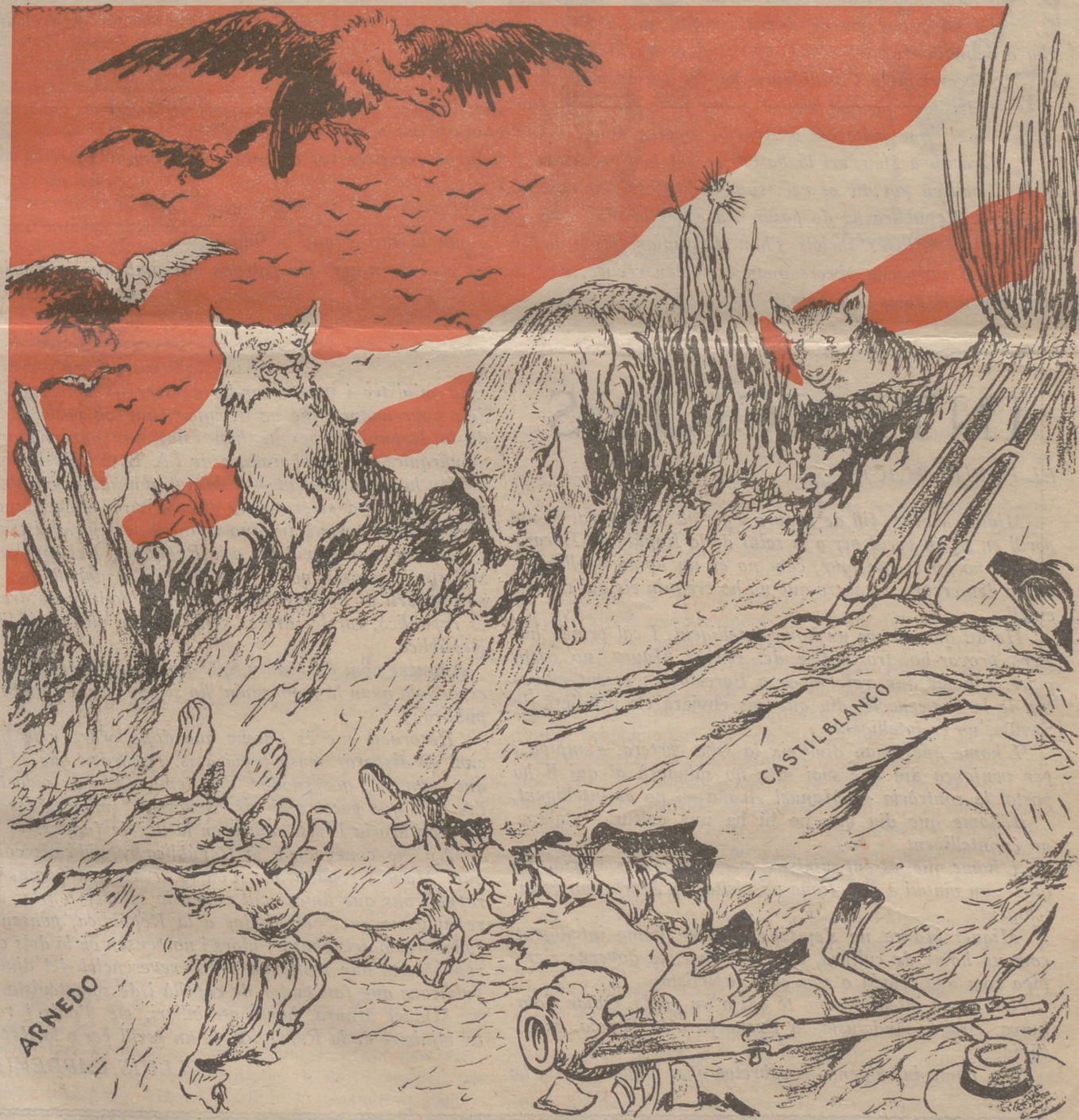
El festí de les dretes