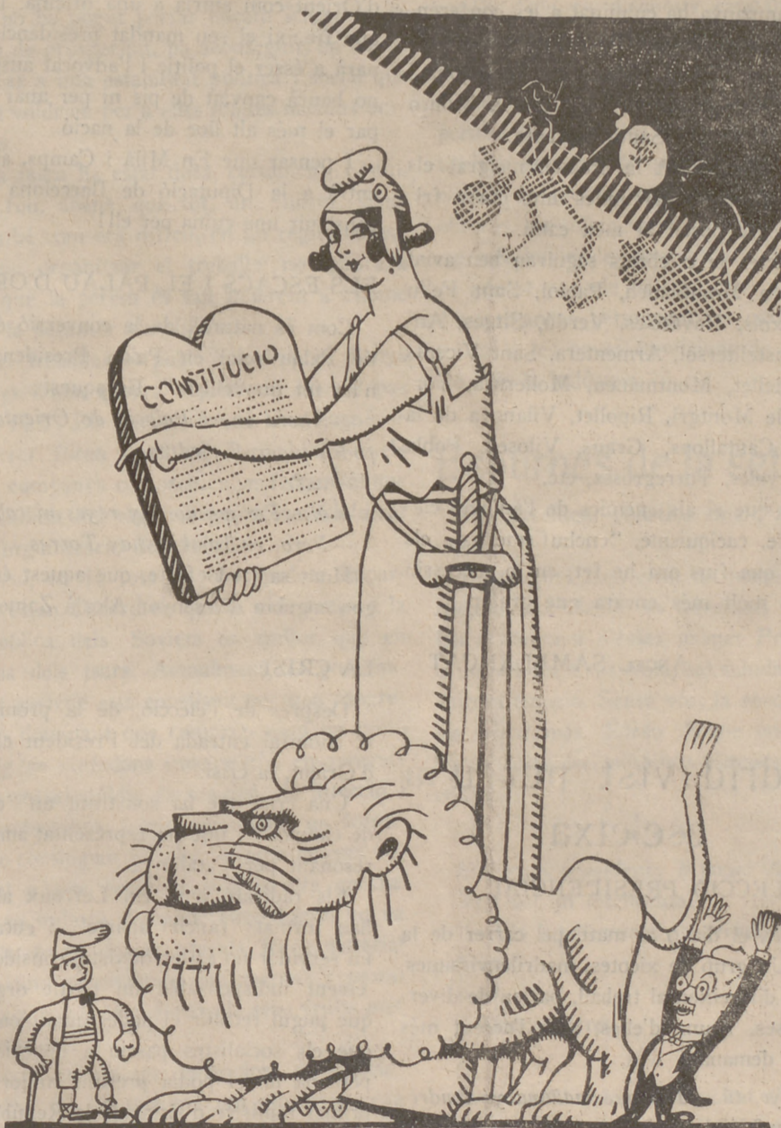
Després d'aprovada la Constitució

—Apa, nois! Ja és nostra; però ara, el que no marxarà dret, g rrotaua, i avall!