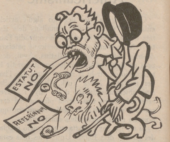
A En Royo Vilanova se li ha indigestat l'Estatut

Fa pocs dies que el rector d'aquest poble, des de dalt de la trona, donà, amb molt poca gràcia, un curset polític-cultural, cosa que cada festa fa, d'ençà que tenim la República, en lloc de predicar les doctrines de Jesucrist.