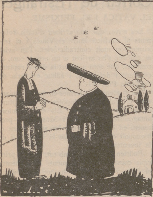
—Es posa malament això; fins el campaner demana augment de sou

Abans "La Voz" i "El Sol" tenien una altra conducta. Però és que abans a "La Voz" i a "El Sol" hi escrivia gent honrada.