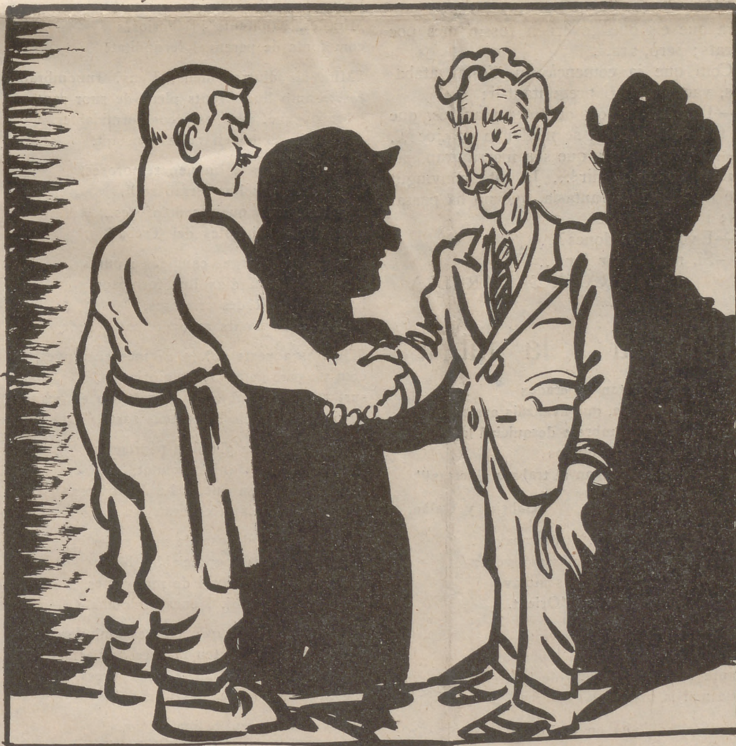
Després de la victòria

Però voldríem també que el govern donés al poble la sensació que viu en un règim de República, i no de monarquia, cosa que, sense l'actuació de Manuel Azaña, no hauria estat possible. Voldríem que els altres ministres siguin, com Manuel Azaña, representants veritables d'una República i no d'una cosa híbrida, apagada i gris que no fa feliços ni els uns ni els altres.