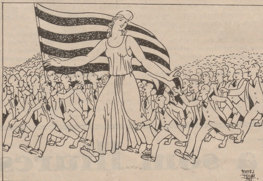
—Ja us n'haveu convençut que la unió fa la força?