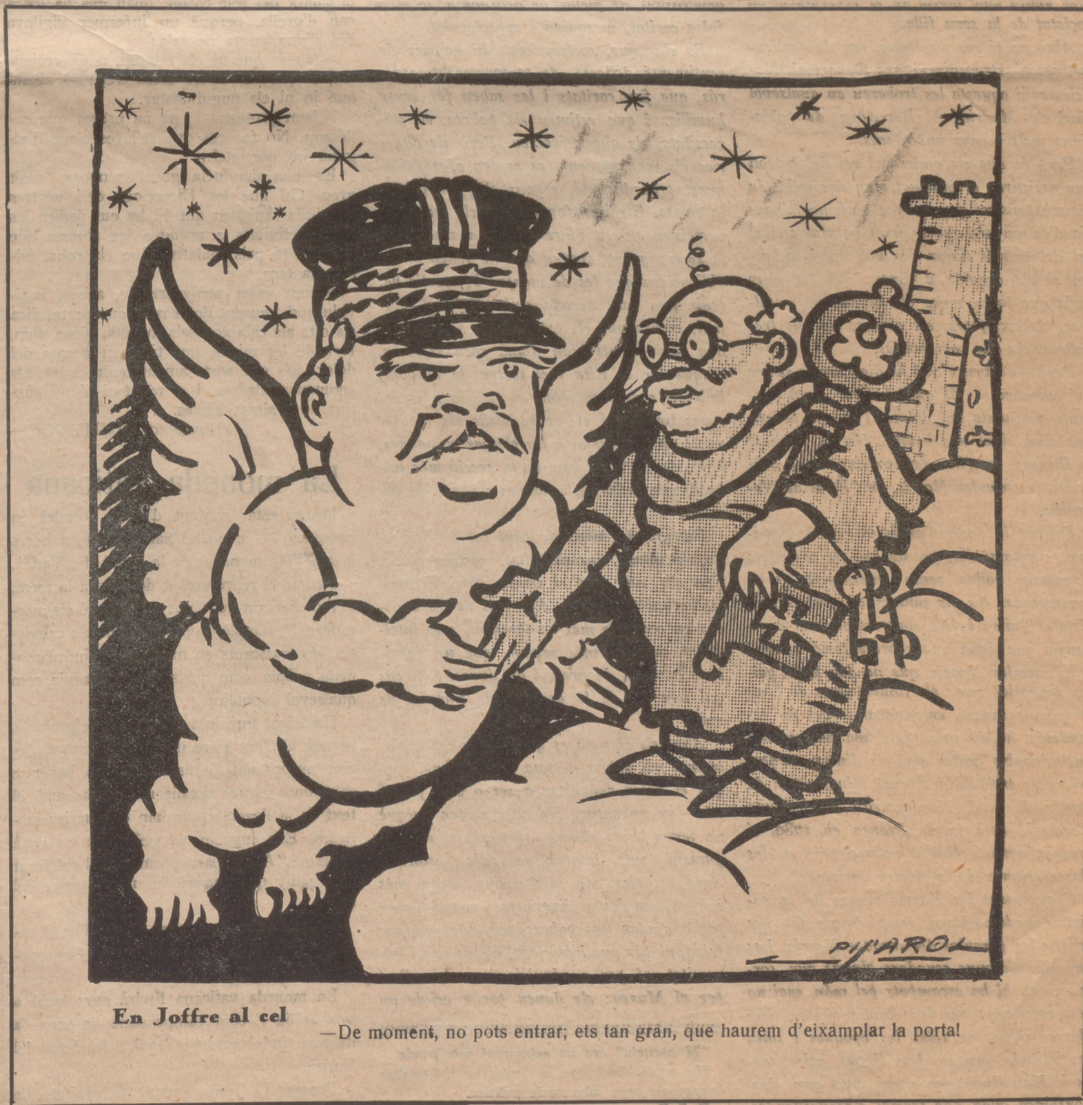
En Joffre al cel

—De moment, no pots entrar; ets tan grán, que haurem d'eixamplar la portal