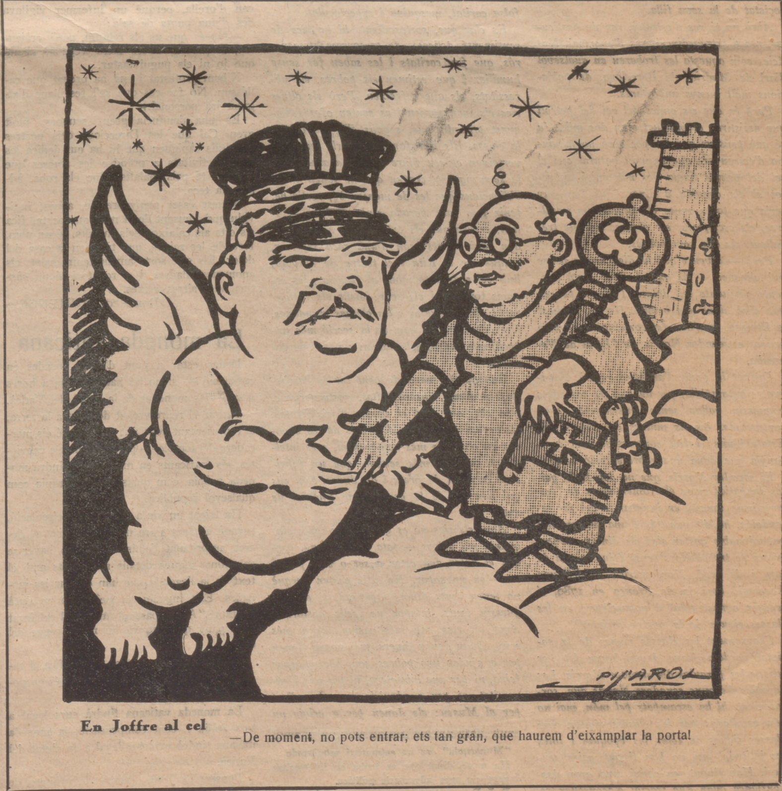
En Joffre al cel — De moment, no pots entrar; ets tan gran, que haurem d'eixamplar la portal