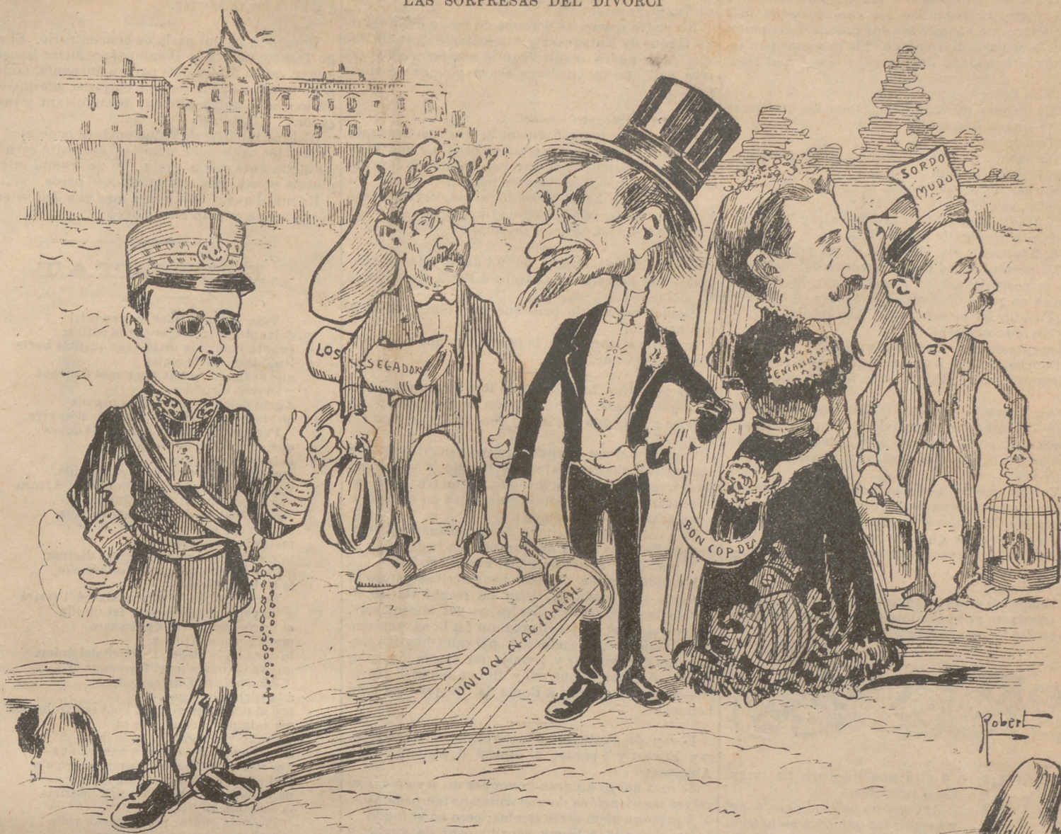
DON CAMILO:—¡Pobre marit! Tan cofoy que hi va, y no recorda que aquesta fulana havia sigut dona meva...

la vulga, qu' en quant als ríchs ja 'ls tractan millor per la por de que no emplehin en contra d' ells la influencia de que gosan, y que per lo vist tan necessitan pera sostenir-se en els lloch que ocupan.