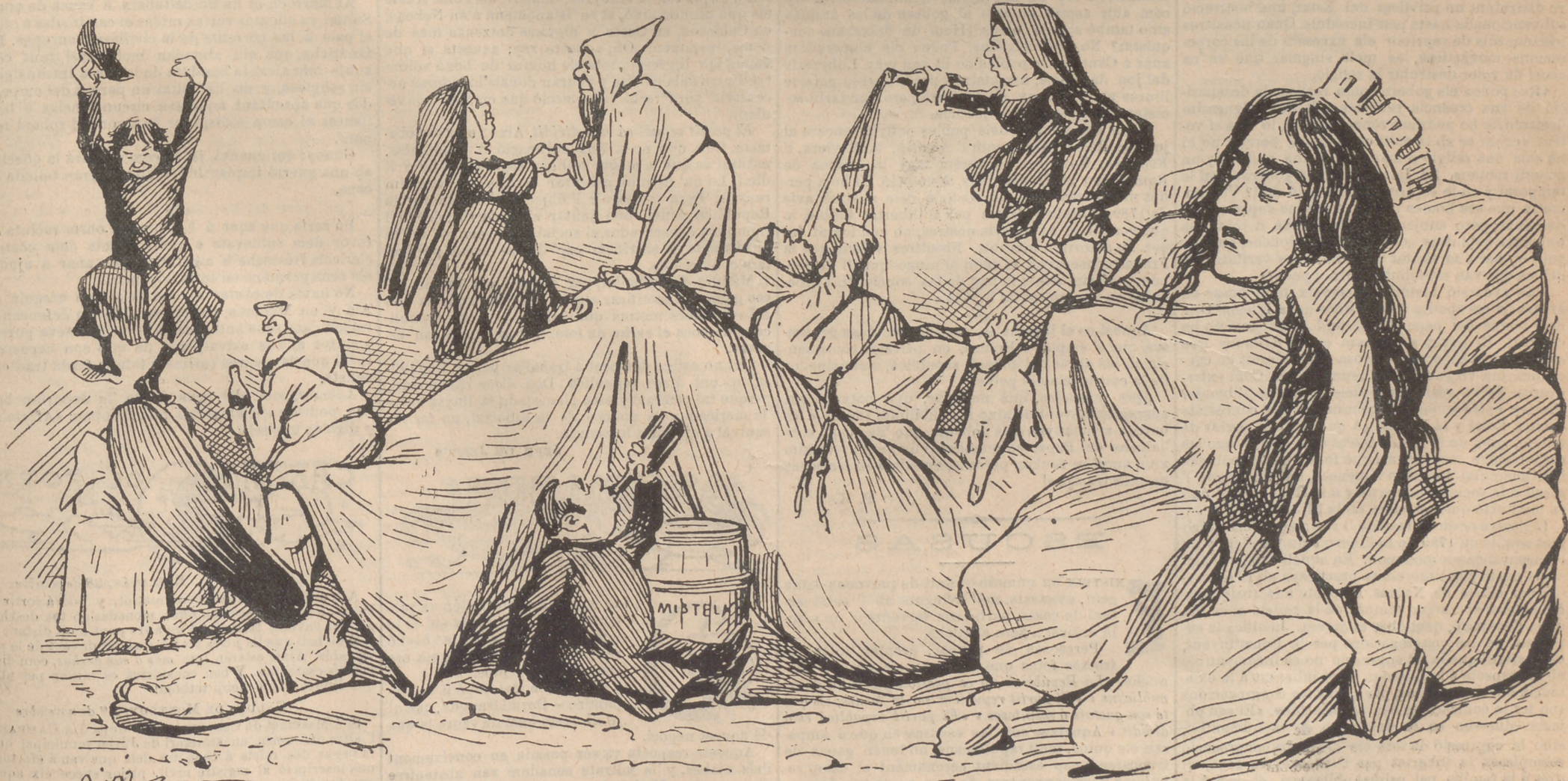
Mentres la nació s' ajeu, extenuada, sense forsas,