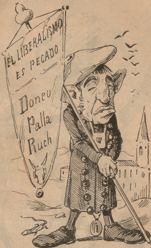
Diu que 'ls carlistas preparan una manifestació y que 'l pastor de la colla té de portá aquest pendó.

—¿Tornan los béns als capellans? —No, ca, aixó may; fent un viatjet de recreo á Lourdes, que aquellas ayguas tot ho netejan, tot ho curan.