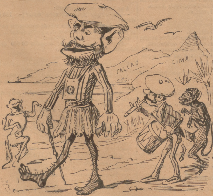
Lo Senyor Canons á América procura que tots lo vegin; bon vent y la barca nova; si 'ls hi agrada que se 'l quedin.