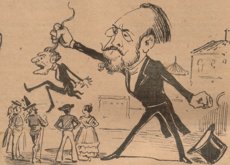
Los conservadors s' irritan y no podentse aguantar, avuy ab furia amenassan y al Octubre pegarán.