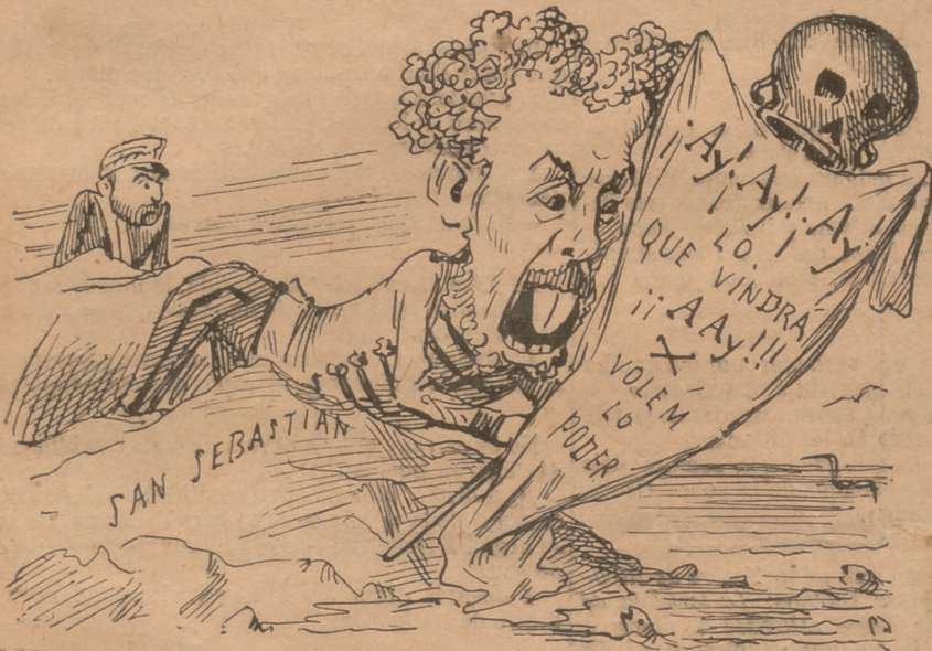
Lo gran partit reformista en mitj de tanta calor cansat de suor y dejunis se dedica á fer la por.