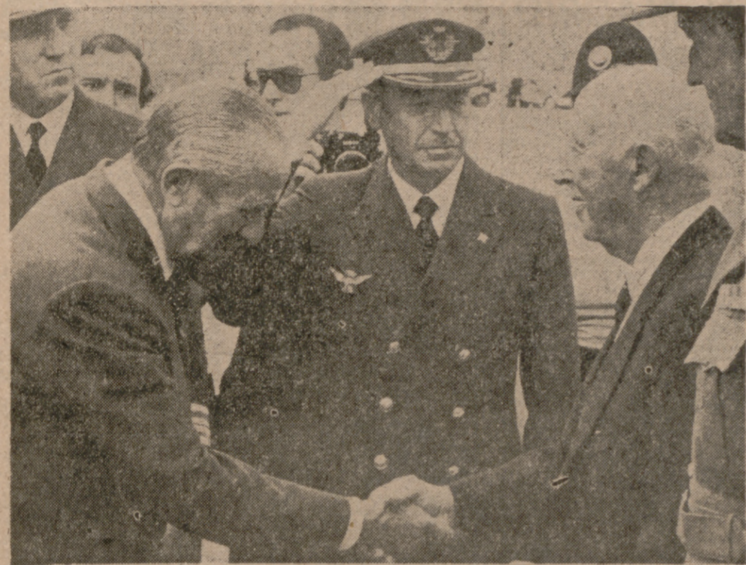
MADRID. — El Jefe del Estado saluda al Presidente del Gobierno, don Carlos Arias Navarro, a su llegada a Barajas.