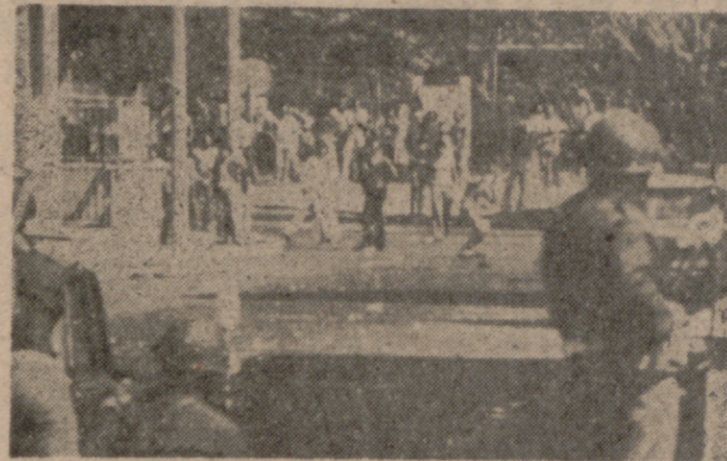
ROMA.—Arriba, un coche envuelto en llamas, durante los enfrentamientos entre la Policía y los chabollistas que habían ocupado varios apartamentos en un suburbio de la ciudad. Durante los incidentes resultaron heridas varias personas, y un joven muerto. Abajo, la Policía hace frente a los manifestantes con granadas lacrimógenas.