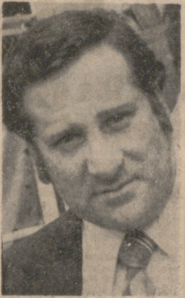
¿Pasará apuros el Valladolid? -Ninguno.

a cero, pues, cuando la primera parte estaba finalizando y cuando hablamos con Cantero, portero que fue un día de nuestro Real Valladolid Deportivo. -¿No estás muy gordo? -No tanto. Ahora peso 99 kilos y he llegado a pesar 105.