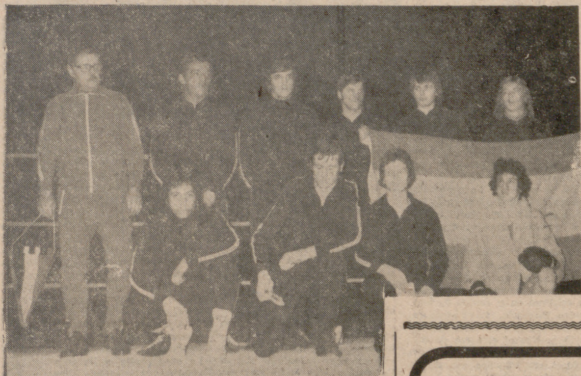
Este es el equipo amateur de Bélgica. Un rival demasiado flojo para la selección española...

Nuestros púgiles se apuntaron ocho triunfos y los belgas sólo uno y en discutible decisión