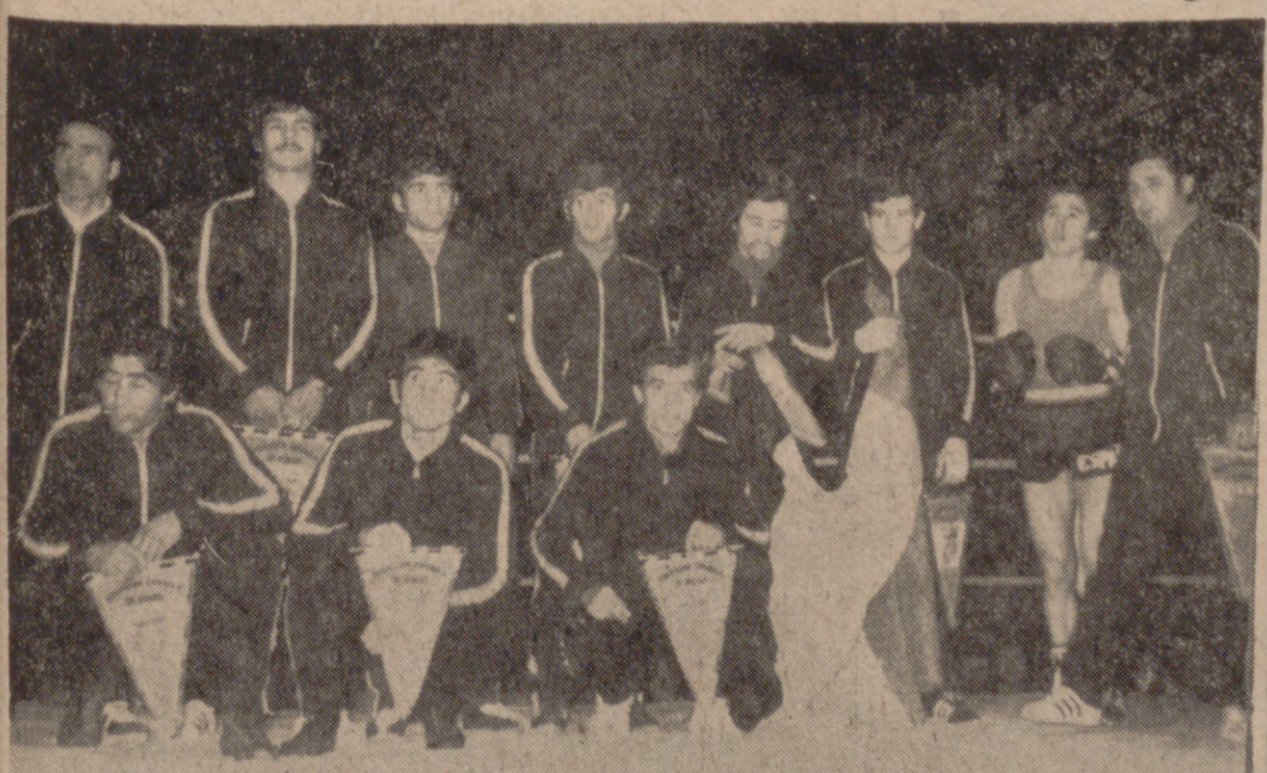
El equipo español, muy superior al belga, resolvió fácilmente su compromiso. Los discípulos de Palavecino posaron para los fotógrafos antes de iniciarse la confrontación del sábado en la Feria de Muestras (INFORMACION EN ULTIMA PAGINA)

Abrumadora superioridad española sobre Bélgica