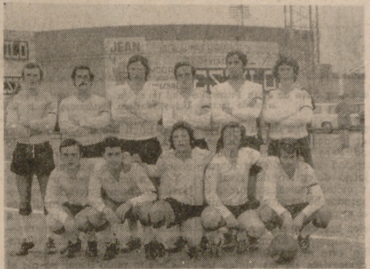
U. D. San Carlos, récord goleador de la jornada a costa del Simancas, a quien aplastó por siete a cero.

El primer tiempo se ha caracterizado por el mejor fútbol de la Ferroviaria y la mayor actividad de la Paz. A pesar de que el Paz ha creado varias ocasiones de gol,