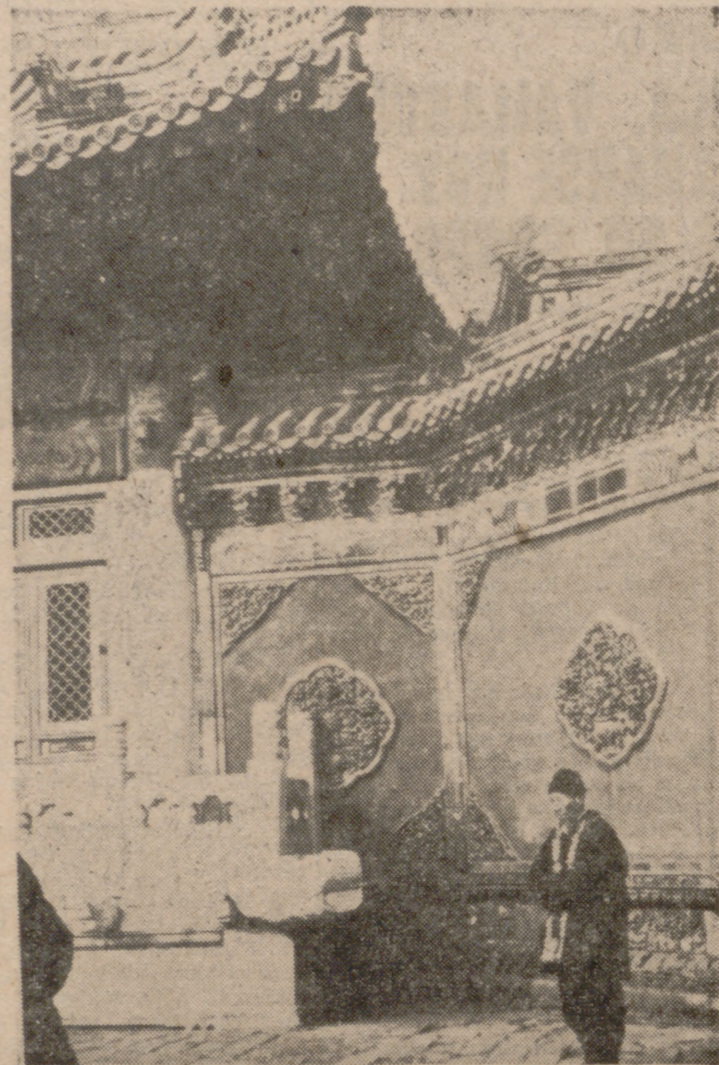
Imagen de una China tradicional, milenaria, hoy día sólo vigente en algunos rincones como este palacio.