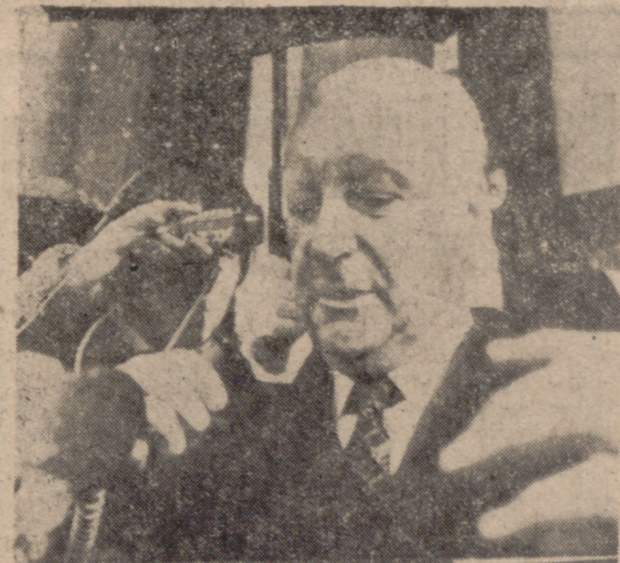
PARIS.—El primer ministro francés, Pierre Messmer, es abordado por los periodistas al abandonar el Palacio del Elíseo, bajo intensa nevada. Messmer anunció la formación de un nuevo Gobierno.

FRANCIA ESTRENA UN GOBIERNO VIEJO LOS MINISTERIOS CLAVE SIGUEN EN LAS MISMAS MANOS