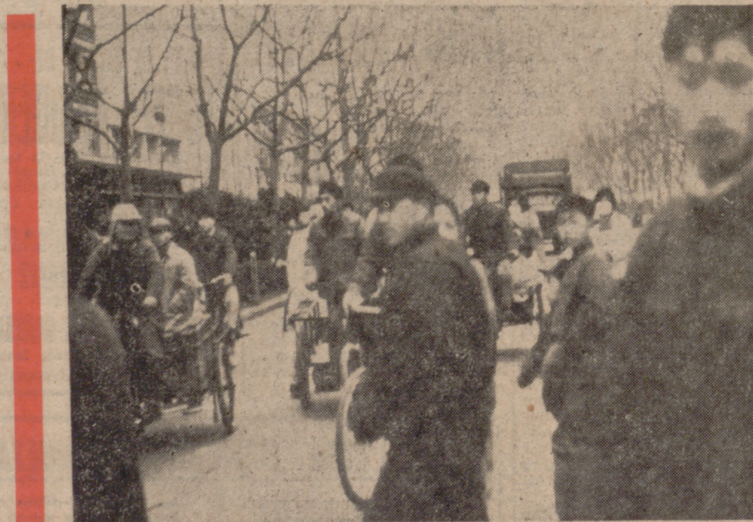
Este aspecto ofrece el tráfico, ciclistas y peatones, por las calles pekinesas.

do de un obrero medio (de cincuenta a sesenta yuans por mes es el sueldo normal y una bicicleta cuesta de 180 a 240 yuans). Por lo tanto, tiene que ahorrar durante algunos años. Y también es cierto que en nuestra sociedad existe todavía alguna mente que no ha comprendido el mensaje que día a día nos ofrece el Presidente Mao con la integridad que sería necesaria. Entre ochocientos millones de habitantes, comprenderás que siempre pue-