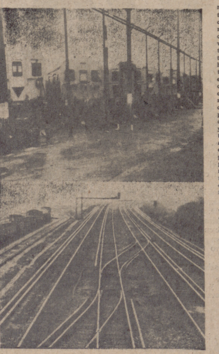
Aspecto de las líneas ferroviarias inglesas durante la última huelga de veinticuatro horas.

Alemania y Japón, dos de las actuales cuatro grandes potencias de la economía y la técnica universal, han podido superar la tremenda catástrofe de la derrota militar de 1945, en la que perdieron tierras, hombres, materias primas e instalaciones, gracias a un esfuerzo gigantesco, a una voluntaria disciplina política y laboral y, sobre todo, gracias a que ni-