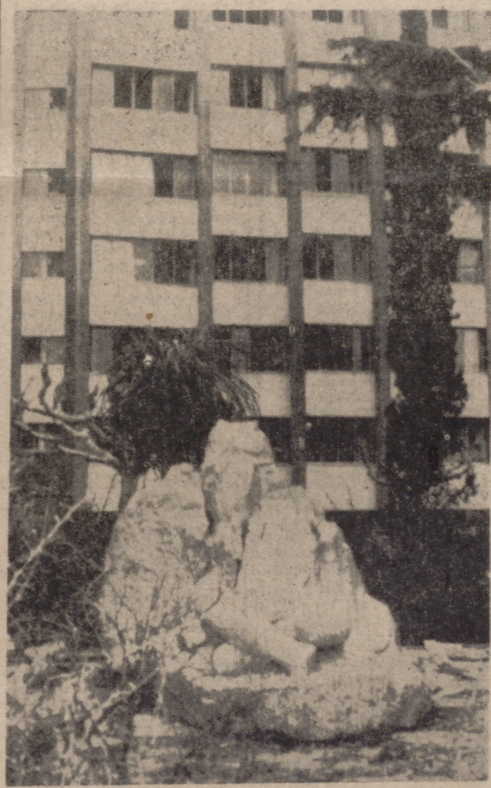
MATARO (Barcelona).—Aspecto de los destrozos causados en el Monumento a los Caídos de esta ciudad, debidos, como informamos ayer, a la explosión de un artefacto. En la Plaza de los Caídos, lugar donde ocurrió el atentado, se encontraron esparcidas por el suelo octavillas firmadas por las agrupaciones clandestinas anarquistas independientes de Barcelona, Mataró y comarca.