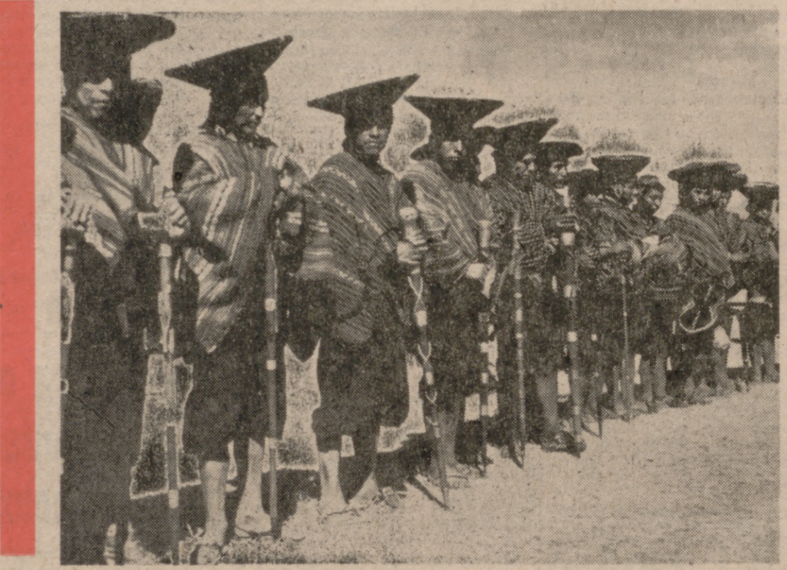
Atuendo y atributo de los Alcaldes Mayores.

mo lo que se lleve a cabo. Y en este orden de cosas, nos parece que el saldo es favorable. Frente al 5 por 100 de propietarios del 83 por 100 de la tierra, han accedido a su disfrute 150.000 familias y se han constituido 500 empresas agrarias. Dentro de dos años estará terminada la reforma, que avanza paralela a la industrial, con la creación de 3.500 comunidades laborales, que suponen el 85 por 100 de la industria. A la par se actúa sobre el capital extranjero y se lleva a cabo la reforma minera y pesquera. Esta última estaba casi en su mitad en manos de extranjeros. Se actúa también sobre el sector financiero con medi-