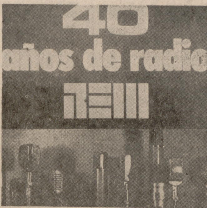
Portada del LP «40 años de radio», editado por la REM.

«40 años de Radio» es el título de un álbum que la Red de Emisoras del Movimiento ha editado en estos días y que resume la labor realizada por la REM en este tiempo a través de las emisoras de radio que componen la cadena.