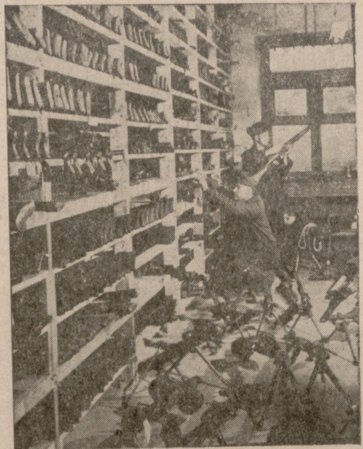
Almacén de un comerciante en armas.