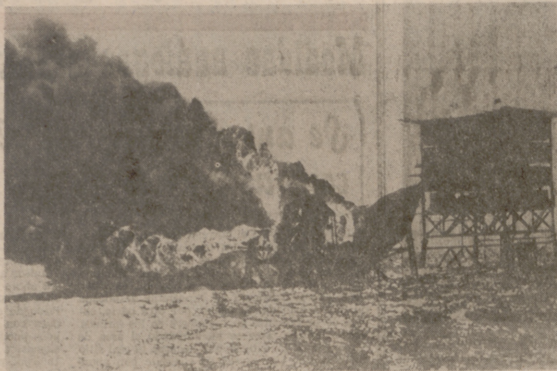
ABU RODEIS (Península del Sinaí).—En la península ocupada por los israelíes se ha declarado un incendio en el complejo petrolífero de Abu Rodeis...