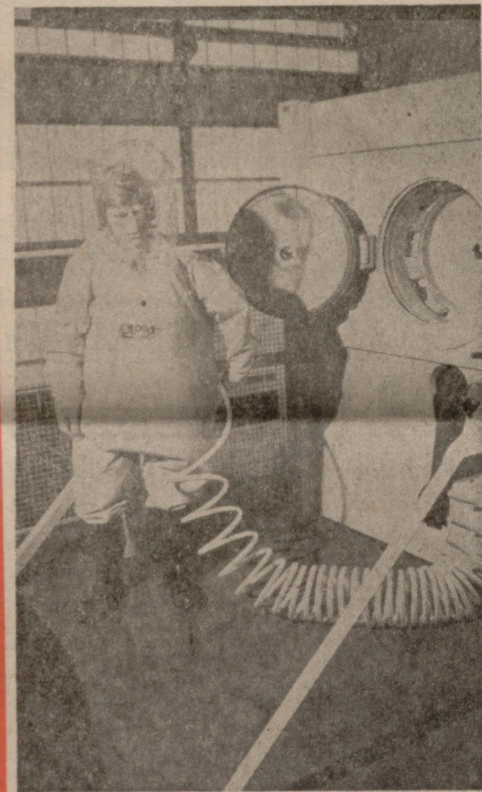
KARLSRUHE.—(DaD).—Este vestido de plástico, soldado, permite entrar sin inconveniente en locales contaminados radioactivamente. La construcción, equipada con radiotelefonía y admisión de aire, fue desarrollada en el Centro de Investigación Nuclear de Karlsruhe (República Federal de Alemania), junto con la industria, y presentada al público como «vestido de protección alfa, de tapa doble». El traje rechaza rayos alfa. Por medio de una miniesclusa de tapa doble, el portador del vestido puede llegar sin peligro a un local contaminado incluso sin venir en contacto con sustancias radioactivas. Parece particularmente ventajoso que el vestido podrá ser utilizado varias veces sin eliminación previa de los vestidos radioactivos. Ya se ha concedido la licencia para la confección del traje protector contra rayos, cuyo uso se recomienda también para hospitales y empresas químicas.