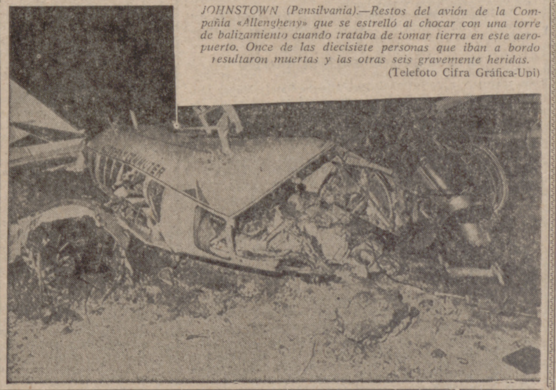
JOHNSTOWN (Pensilvania).—Restos del avión de la Compañía «Allengheny» que se estrelló al chocar con una torre de balizamiento cuando trataba de tomar tierra en este aeropuerto. Once de las diecisiete personas que iban a bordo resultaron muertas y las otras seis gravemente heridas.