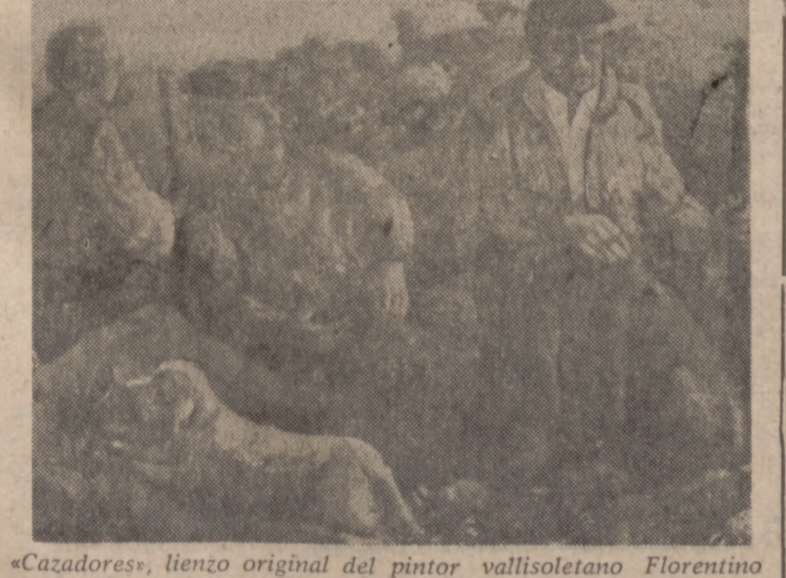
«Cazadores», lienzo original del pintor vallisoletano Florentino Hernando, que expone en la Sala de Salamanca.