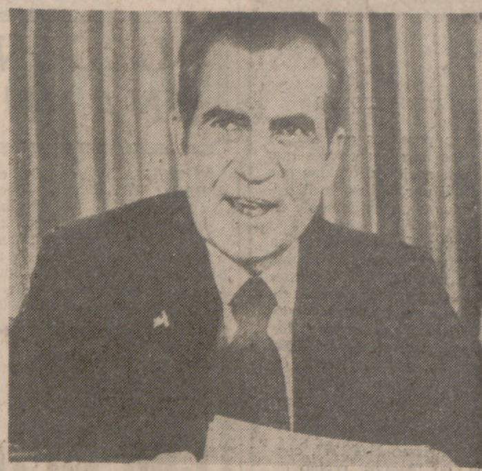
WASHINGTON.—El Presidente Nixon durante su discurso difundido por radio y televisión a todo el país, proclamando su inocencia en el «caso Watergate», negando complicidad alguna y acusando a los investigadores del Senado de tratar de hacerle responsable a él personalmente. El Presidente posó para esta película después de dirigir la palabra. No se permitió a los fotógrafos captar fotos durante su alocución.

Luego, el Presidente ha aceptado la total responsabilidad por los hechos, por haber ocurrido éstos durante su mandato, y criticó acremente a los que manejan el asunto para paralizar la Administración, y ha buscado el origen de los hechos en la decadencia de los sesenta, de romper la ley en nombre de una más alta moralidad, creando una epidemia de manifestaciones de los fines por los medios, que si en aquellos momentos fue aplaudida por los medios informativos y la opinión, hoy es duramente criticada con propósitos políticos tal vez demasiado descarados.