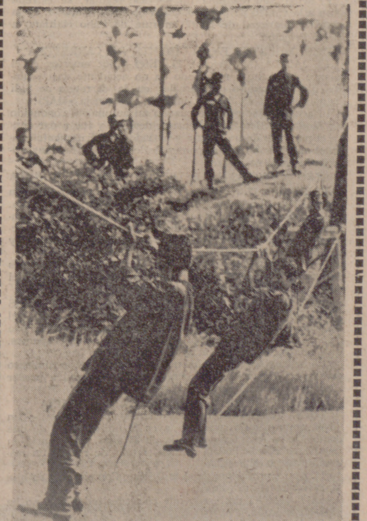
PHNOM PENH (Camboya).—Los camboyanos en edades comprendidas entre los 18 y 35 años son reclutados y se procede a su adiestramiento militar en un campamento situado en Kamboi, a 19 kilómetros al oeste de la capital, a lo largo de la autopista número 4. Después de dos meses de entrenamiento, son enviados al campo de batalla. La foto capta un momento del entrenamiento de los reclutas.