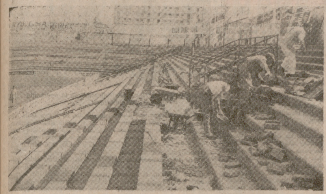
EL ESTADIO, EN OBRAS.—Ayer se iniciaron las obras en los graderíos del Estadio para variar la disposición de algunas localidades de asiento y de pie. Los obreros tendrán que trabajar de firme, porque todo debe estar listo para el día 28, con ocasión del primer encuentro del Torneo Internacional "Ciudad de Valladolid".

La solución de lo Macanás, el día 22, si es que antes no se ha fichado a un uruguayo