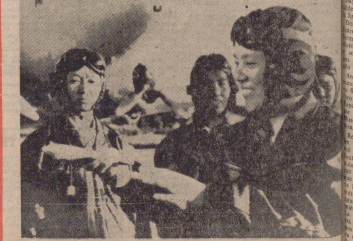
PEKIN.—Mujeres pilotos chinas, pertenecientes a las Fuerzas Aéreas de Liberación Popular durante un curso de instrucción sobre el manejo de bimotores, en un aeropuerto próximo a la capital comunista.