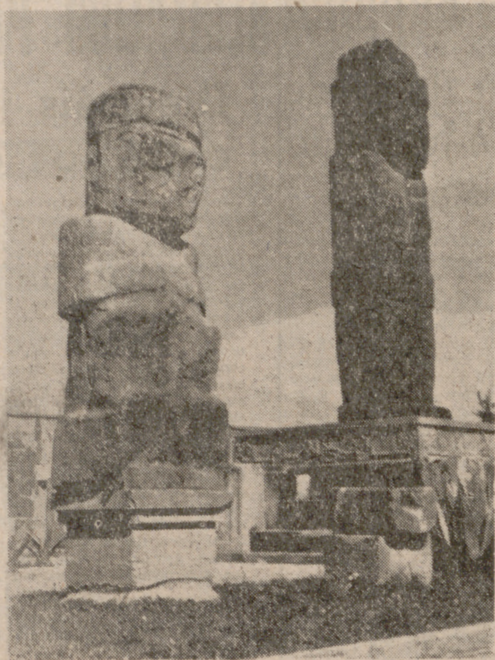
Estos son los monolitos del templo Tiahuanaco.

Estas representaciones tan pródigas en imágenes como