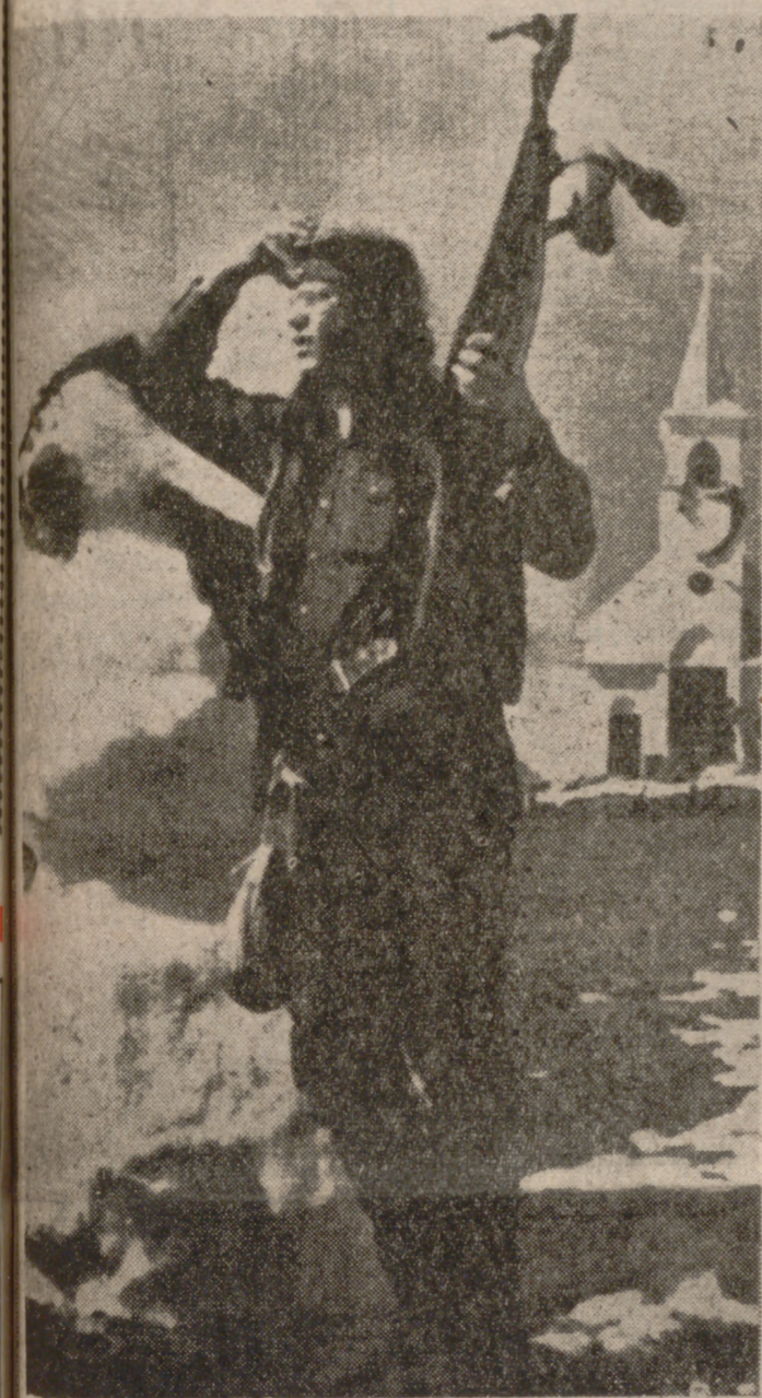
Los Sioux de Rodilla Herida siguen con sus reivindicaciones. Un centinela, con las plumas en el cañón de su arma, avizora con sus ojos tras los lentes de montura de oro.