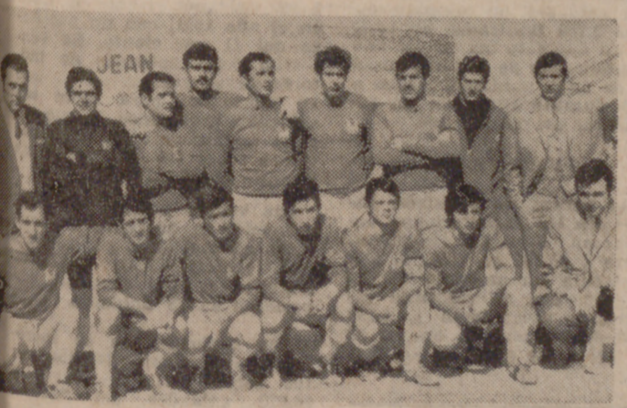
GRUPO EMPRESA FASA