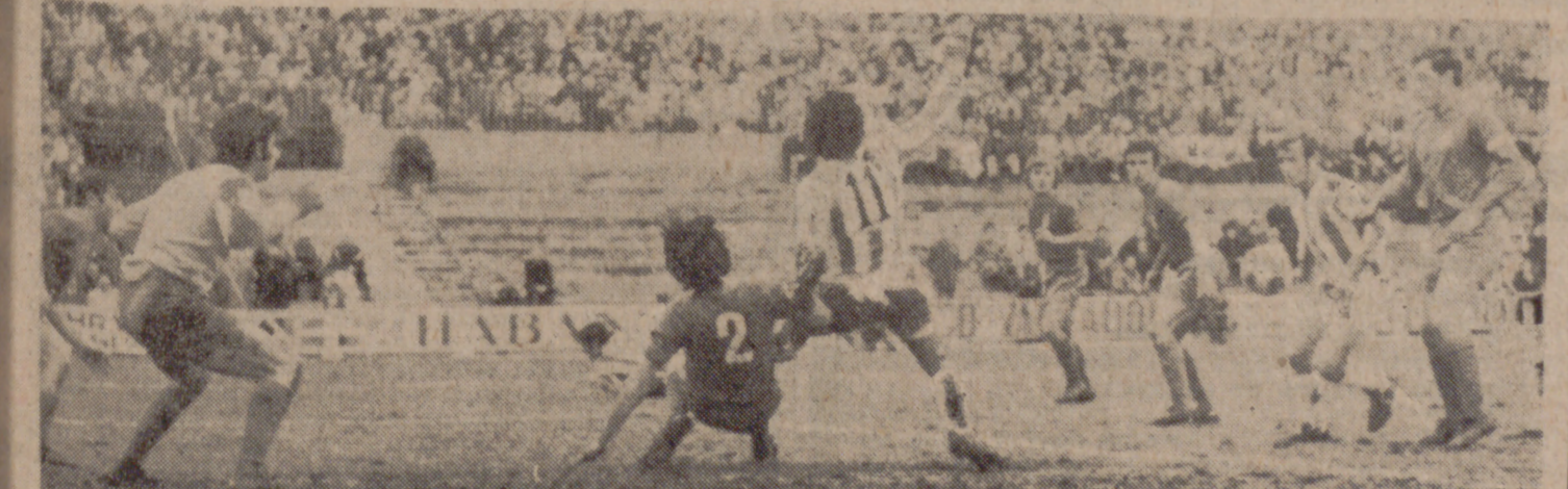
BOSMEDIANO, EN LA BRECHA.—El extremo canario fue el más tenaz y batallador de los delanteros. Aquí le vemos tratando de remarcar un balón, en pugna con Hernández, su secante.