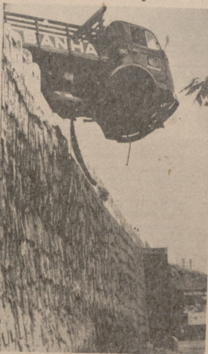
RIO DE JANEIRO.—La cabina de un camión cuelga peligrosamente sobre un paso elevado, tras haber chocado el vehículo contra un "quitamiados" en las afueras de esta ciudad.