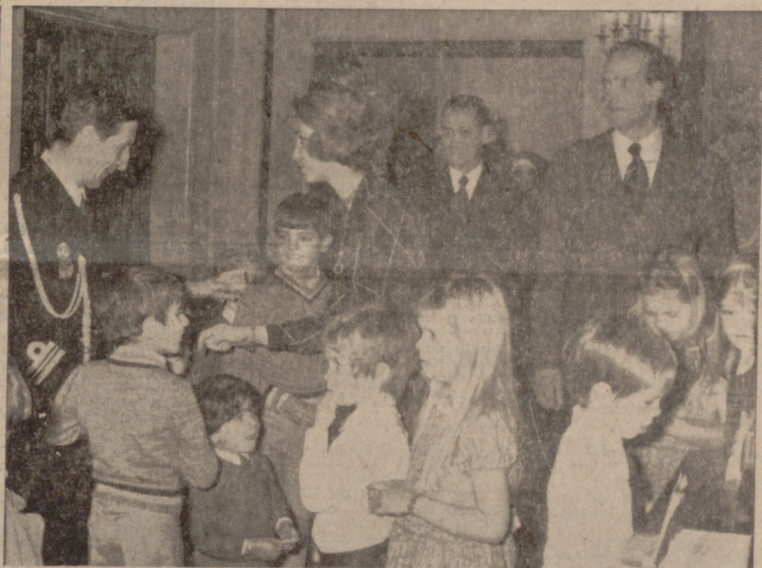
MADRID.—Los Príncipes de España recibieron en el Palacio de la Zarzuela a los miembros del Comité Ejecutivo de la Feria del Juguete que, presidido por las autoridades valencianas, hicieron entrega a los Príncipes de un lote de juguetes para sus hijos los infantes y los del personal de dicho Palacio.