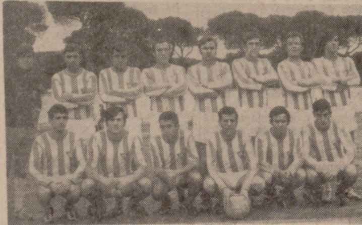
El Atlético Valladolid, fuertemente batido por el Giron, en Segunda Categoría.

Bastantes goles se marcaron en la jornada de ayer en Segunda Regional. En el grupo tercero, el C. D. Giron se mostró ambicioso y jugando un fútbol rápido desbordó una y otra vez al Atlético Valladolid, que se mostró más inferior de lo que se esperaba. El resultado de cinco-uno favorable al Giron es suficientemente concreto como para evidenciar los méritos de los vencedores, que hicieron un excelente partido.