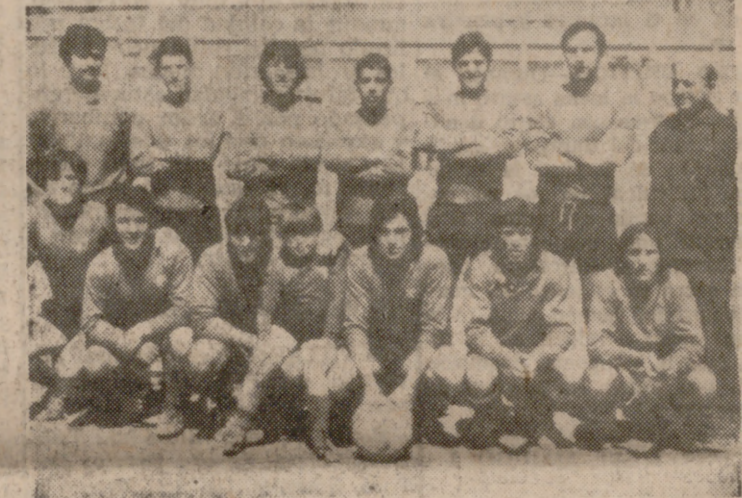
El San Pedro Regalado, que sólo al final pudo conseguir empatar el encuentro.