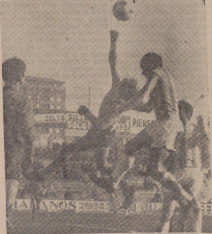
El meta bañezano resuelve acertadamente una situación de peligro para su marco.

U. D. Sur, 1; Pinar, 1. Corberó Delicias, 2; S. D. Rondilla, 0. Asklepios, 0; La Antigua, 0.