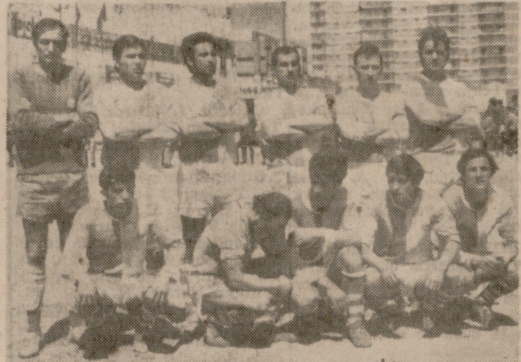
Buen partido el que jugó el Circular, logrando un valioso empate a domicilio.

Triunfo cómodo del Jar, que jugó mejor que su oponente, aunque el Instituto de Colonización se viera totalmente desasistido de la fortuna, porque pudo