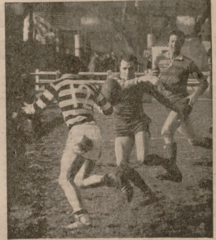
Una de las jugadas peligrosas en la línea de ensayo catalana.

En relación con el ofrecimiento del equipo de Tercera División, S. D. Compostela, y con tan triste circunstancia, se recuerda en esta ciudad que el Sevilla Fútbol Club hace veintitantos años, se despla-