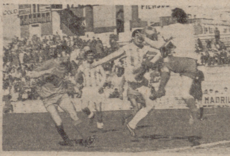
En la media visitante atrapa un balón que pretendía rematar Nike. Ambos chocaron sin mayores consecuencias.

El señor Peña, colegiado de turno, quiso estar a tono con las circunstancias y quitó un par de veces la razón a su juez de línea, que era realmente quien la tenía.