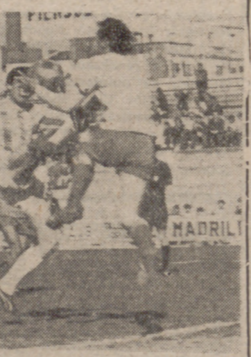
El dominio del conjunto fasista se hizo más acentuado en el segundo período; pero seguían los atilleros sin aprovechar las oportunidades ante la puerta palentina.