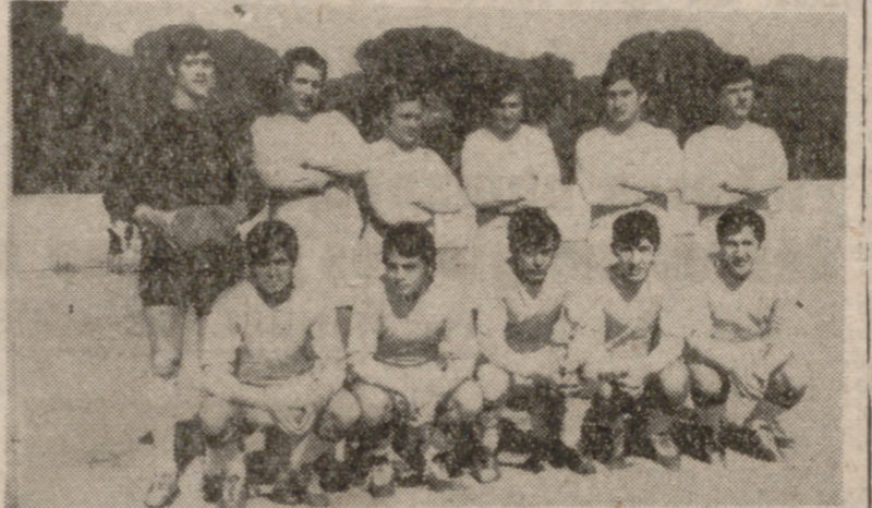
El Arces luchó mucho ante el Valladolid, pero al final hubo de doblegarse.

Destacaron por el Real, Ricardo y Bristo. I. N. C., Burgos, que dio de todo el juego del I. N. C.