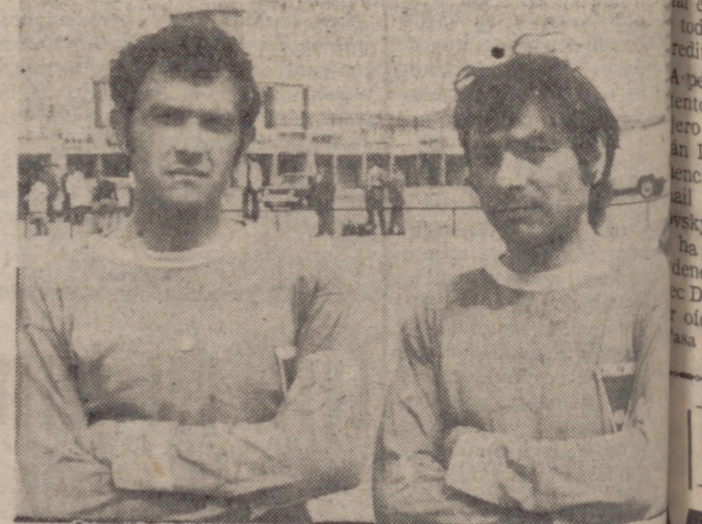
Los medios volantes del I. N. Colonización Volvo, que con una lucida actuación.

Peña Lorenzo, 0; Europa Delicias, 0. Asklepios, 1; At. Sava, 1. Choco El Castillo, 2; Aquilas, 0. Industrial Delicias, 1; G. E. Fasa, 2. Nido, 1; Azor, 1.