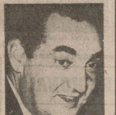
Taimanov, otro gran campeón soviético utilizado ahora como simple "sparring" de Spaski.