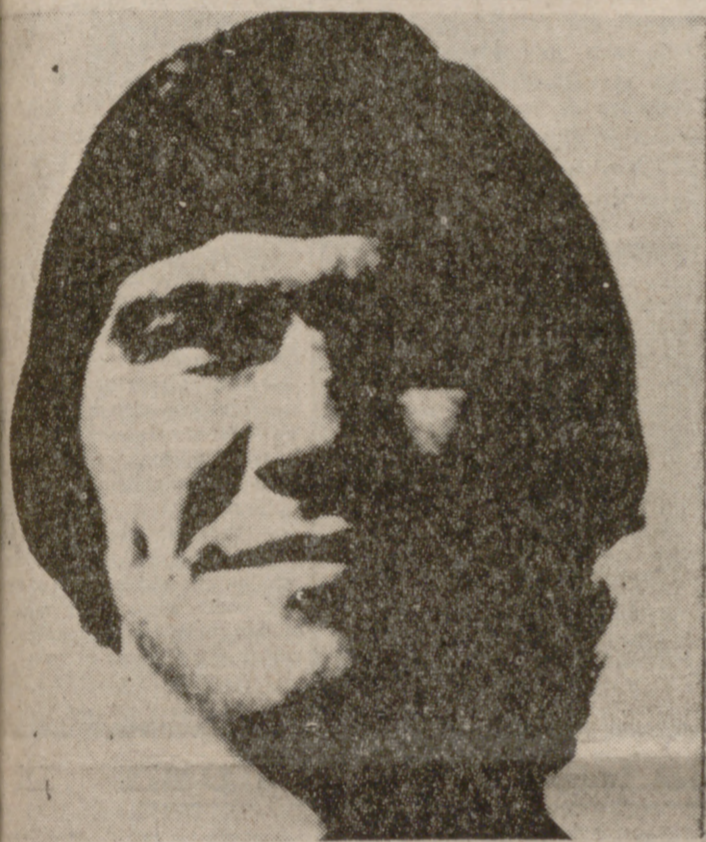
Docal: descanso hasta el jueves.

PONTEVEDRA.—(Crónica del corresponsal deportivo de PYRESA, DE LA TORRE, especial para CASTILLA DEPORTIVA). El Pontevedra ha sido superior en dominio y en oportunidades de gol a un Valladolid que salió con un 5-2 que, naturalmente, favorecía la presión pontevedresa, que ya desde el minuto inicial creó gran número de oportunidades de gol ante la portería de Aramayo. Así, a los once minutos alcanzaba Carballada el primer gol de la tarde en un impecable remate de cabeza y aun cuando empató poco después el Valladolid, en un contraataque en el que la defensa local falló lamentablemente, es lo cierto que el Pontevedra debió irse ya al descanso con una más holgada ventaja que el 2-1 que señalaba el marcador. Después del descanso siguió la misma tónica de presión del equipo pontevedrés, aun cuando el juego no fuera tan bueno como el realizado en el primer periodo. Sin embargo, la superioridad del Pontevedra fue clara y posteriormente se confirmó que el resultado que campeaba en el marcador fue el que dio la oportunidad al Valladolid en un go-