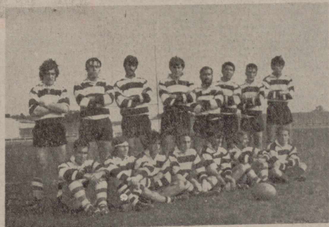
El Salvador, jugando un formidable partido, acabó con la imbatibilidad del Canoe... en Madrid!

MADRID. (PYRESA).—Con los resultados de la sexta jornada, la Liga Nacional de rugby entra en una fase muy interesante, igualando a los equipos participantes y, sobre todo, demostrando que no hay ningún conjunto invencible. Nos referimos, especialmente, al Canoe N. C., que marchaba destacado e invicto en las cinco primeras jornadas con una superioridad que parecía inatacable, pero en su encuentro de ayer, en la Ciudad Universitaria, recibió a El Salvador, que salió al campo sin complejos de ningún género y realizó un partido sensacional, acosando siempre, ligando precisas jugadas de ataque, placando mucho y bien en general, defendiendo excelentemente y jugando siempre con gran inteligencia. (Pasa a la página siguiente)