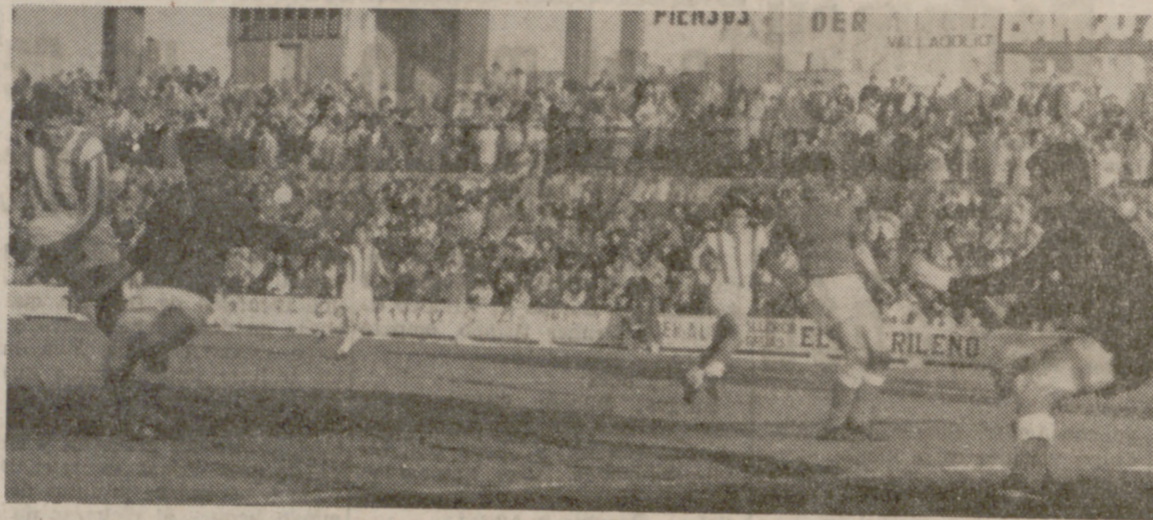
Una buena ocasión que Tirone, disparando fuera, desaprovecharía.