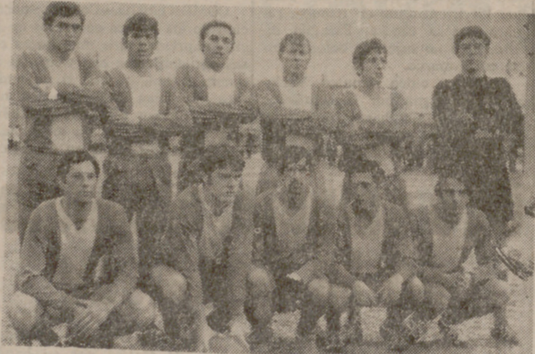
El Pajarillos, al vencer al Victoria León, se perfila como un serio aspirante en su grupo.

Resultados normales en la jornada de Segunda Categoría. En el grupo primero, el Cenfarcos fue superado por el At. Rondilla en un partido muy disputado y con bastante niebla y frío, ya que se jugó a las nueve menos cuarto de la mañana en El Pinar.