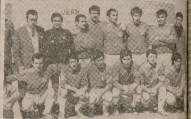
En un ardoroso partido, el Sava ganó a la Ferroviaria.

Bonito partido, sobre todo en la primera mitad, por los muchachos de Alba, ligando muy bonitas jugadas y demostrando una preparación física y técnica muy buenas, pero faltándoles lo que a la mayoría: el tiro a puerta.