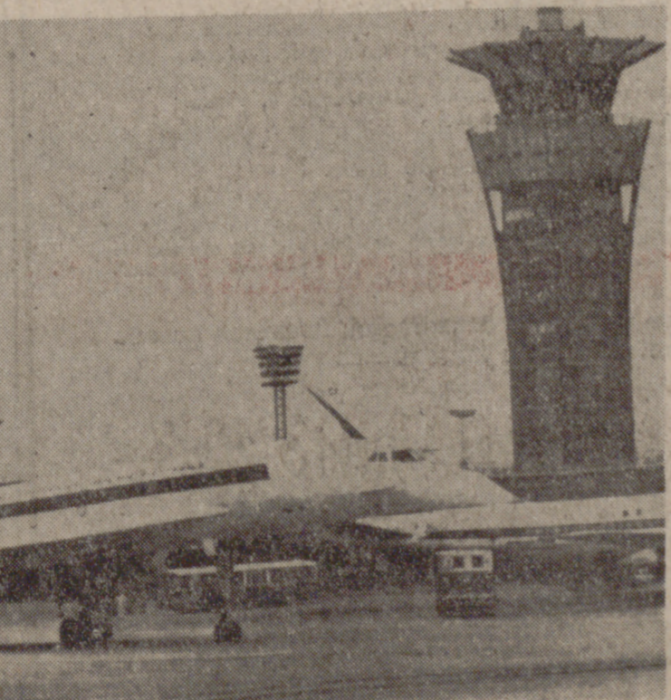
PARIS.—Por primera vez el avión an-fo-francés "Concorde" está aparcado en las pistas del aeropuerto parisiense de Orly. El avión espera al Presidente francés, Georges Pompidou, que se trasladó en él a las islas Azores para entrevistarse con el Presidente norteamericano, Richard Nixon.

NIXON, EN LAS AZORES CONVERSÓ CON CAETANO ESTE CON POMPIDOU ANGRA DO HEROISMO (Efe-Upi).—El Presidente Nixon llegó a las Azores por avión y a las 11.05 en términos de franca cordialidad. El Presidente norteamericano se entrevistó con el presidente portugués, Richard Nixon, en la isla Terceira. Ambas estadías han permitido hablar en la base de las por espacio de cincuenta minutos, desde las 11.05 a las 11.55 en términos de franca cordialidad. El Presidente norteamericano se entrevistó con el presidente portugués, Richard Nixon, en la isla Terceira. Ambas estadías han permitido hablar en la base de las por espacio de cincuenta minutos, desde las 11.05 a las 11.55 en términos de franca cordialidad.