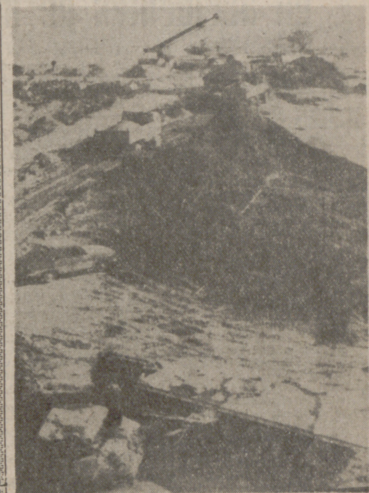
SAN FELIU DE LLÓBREGAT (Barcelona).—Estado en que ha sido encontrado el camión que se precipitó por el Puente de San Felú, en el momento en que éste se hundía. El ocupante u ocupantes no han sido encontrados y la cabina se encontraba vacía. Por otra parte, se han iniciado ya los trabajos para reparar el puente, mientras se construye otro provisional al lado del mismo.

La carta de Indira Gandhi leída leída por Singh al final de un largo discurso de más de dos horas, obligó a interrumpir por algunos minutos la sesión del Consejo, convocado a petición de los Estados Unidos.