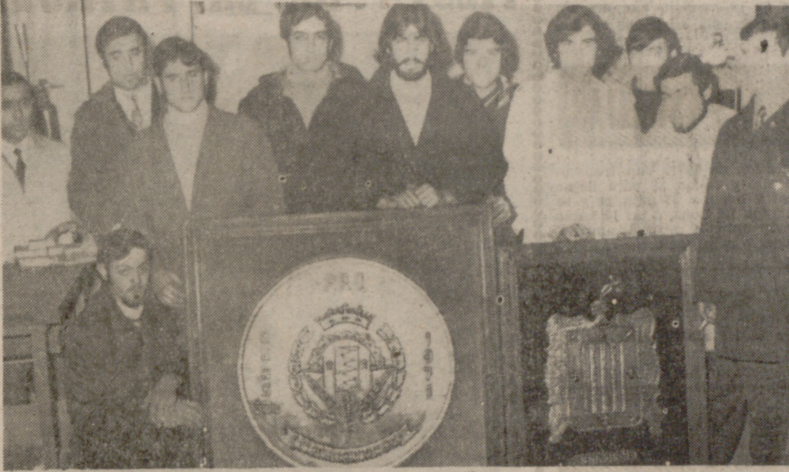
ASISTENTES AL CURSO

Ayer, a las siete y media, en uno de los pabellones de la Feria Nacional de Muestras, se efectuó la clausura del curso de soldadura semiautomática bajo atmósfera de CO 2 , que el Programa de Promoción Profesional Obrera ha venido impartiendo durante cuatro meses, a cuatro horas diarias, compatibles con la jornada laboral, en colaboración con la Sociedad Española de Oxígeno.