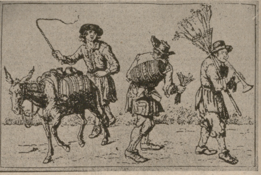
Los pregoneros y vocadores fueron durante siglos los únicos anunciantes. En el grabado, pregoneros de aceite, vino y juguetes, en la Edad Media.

ruinas de Pompeya se descubrieron numerosas losas con inscripciones de carácter comercial. Las había muy literarias, al estilo de aquel tiempo, como aquella que decía: "Viajero; desde aquí, a doce esquinas, encontrarás a Sarnus, hijo de Pubellus, que podrá darte albergue. ¡Salud!" Cicerón y Séneca se refirieron a la publicidad relativa a la venta de bienes de los proscritos, de los deudores insolventes y de otras actividades del comercio. Los juegos, como se sabe, eran convenientemente anunciados por medio de vocadores y de inscripciones murales. Todo ese mundo brillante