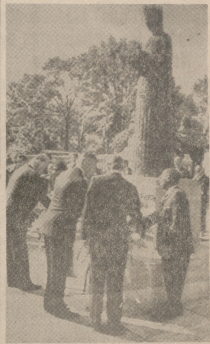
WASHINGTON.—De izquierda a derecha, don Galo Flaza, secretario general de la Organización de Estados Americanos; don Enrique Suárez Puga, encargado de España de las Relaciones Interamericanas, y don Jaime Argüelles, embajador de España en los Estados Unidos, depositan una corona de flores ante el monumento a Isabel la Católica que se levanta frente al edificio de la sede de la Organización de Estados Americanos.