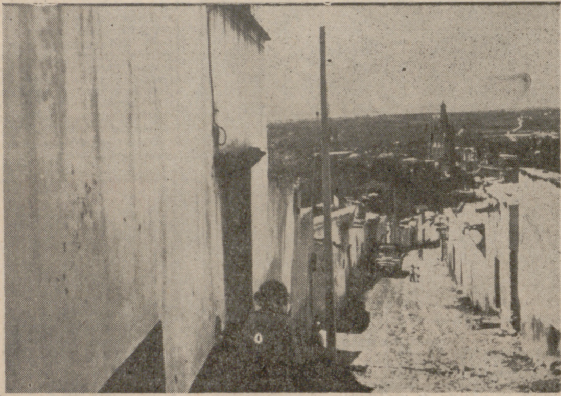
SAN MIGUEL ALLENDE

He recorrido el México colonial: San Miguel Allende, Yuriria, Morelia (antigua Valladolid)... El convento-fortaleza de Yuriria (1553), domi-