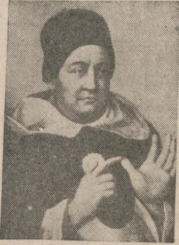
Santo Tomás, príncipe de la teología de la Iglesia Católica.

Hace pocos días escribíamos sobre el Congreso Mariológico celebrado recientemente en Zagreb y cifrábamos esperanzas en sus óptimos frutos. No es de menor importancia el simposium teológico que se está celebrando en Viena y en el que toman parte hombres muy cultos en las ciencias sagradas. Es la primera vez, desde hace 1.500 años, que se celebra un encuentro teológico entre teólogos de todas las iglesias orientales juntamente con los católicos romanos. Es natural que en este Congreso de teólogos orientales y de la Iglesia Católica el primer punto a tratar sea el relacionado con aquella triste separación en 451, época del Concilio de Calcedonia. Por este encuentro de las grandes figuras de la teología y porque algunos lectores me lo han pedido, voy a escribir este artículo sobre: ¿Qué son los teólogos y para qué sirven?