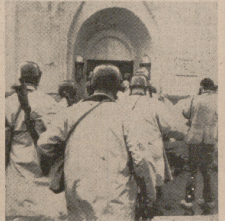
ATTICA (Nueva York). — Fuerzas armadas estatales, con fusiles y cascos, entrando en la prisión de Attica poco antes de llevar a cabo un ataque en masa en el interior para reducir a los reclusos amotinados.

NUEVA YORK. — (Del corresponsal de PYRESA, Guy Bueno). — Poco a poco se fue disipando la espesa nube de gases lacrimógenos, nauseabundos, lanzados con tanta abundancia sobre la cárcel de Attica, que incluso la atmósfera en los alrededores del presidio se convirtió en irrespirable. Pero la negra sombra proyectada por la tragedia de Attica sobre el pueblo americano parece ser más duradera.