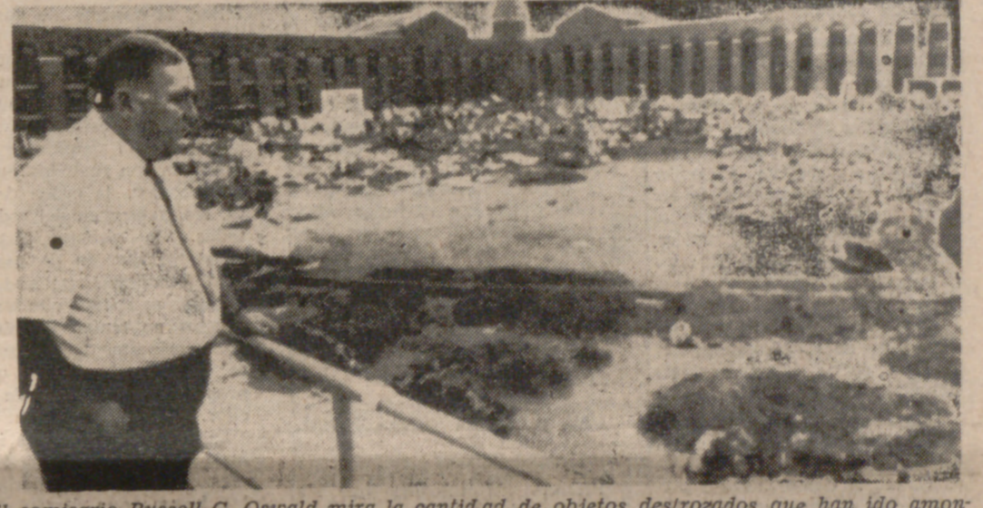
El comisario Russell G. Oswald mira la cantidad de objetos destruidos que han ido amontonándose en el patio de la prisión durante los cuatro días de amotinamiento.

El balance provisional — pues son muchos los heridos graves — es: 10 guardias asesinados, 30 presidiarios ejecutados. Si hoy se habla (Pasa a la página siguiente)