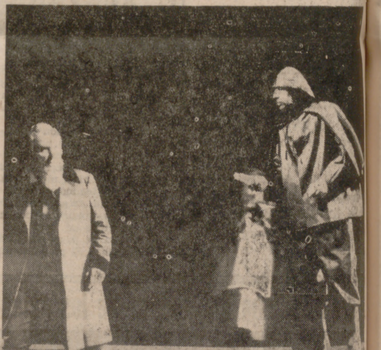
Una escena de "Romance de lobos"

Hoy, debut de la Compañía del Marqués Guerrero con "Romance de lobos"