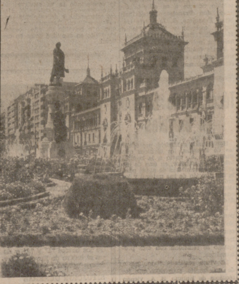
EDUCACION Y CIENCIA

Agua, flores, una gran perspectiva desde cualquier ángulo. La Plaza de Zorrilla es un buen descubrimiento para el viajero. Valladolid tiene en ella un buen ejemplo de urbanización aunque todavía le falte llenar el hueco que dejara el Teatro Pradera, a no ser que la solución de emergencia del escudo floral sea considerada como definitiva. Por lo demás, no hay duda que la ciudad puede sentirse orgullosa de este núcleo urbano al que la Academia de Caballería aporta un valor especial. De plazas como ésta, aunque sea a escala más reducida, estamos muy necesitados. — (Foto Carvajal.)