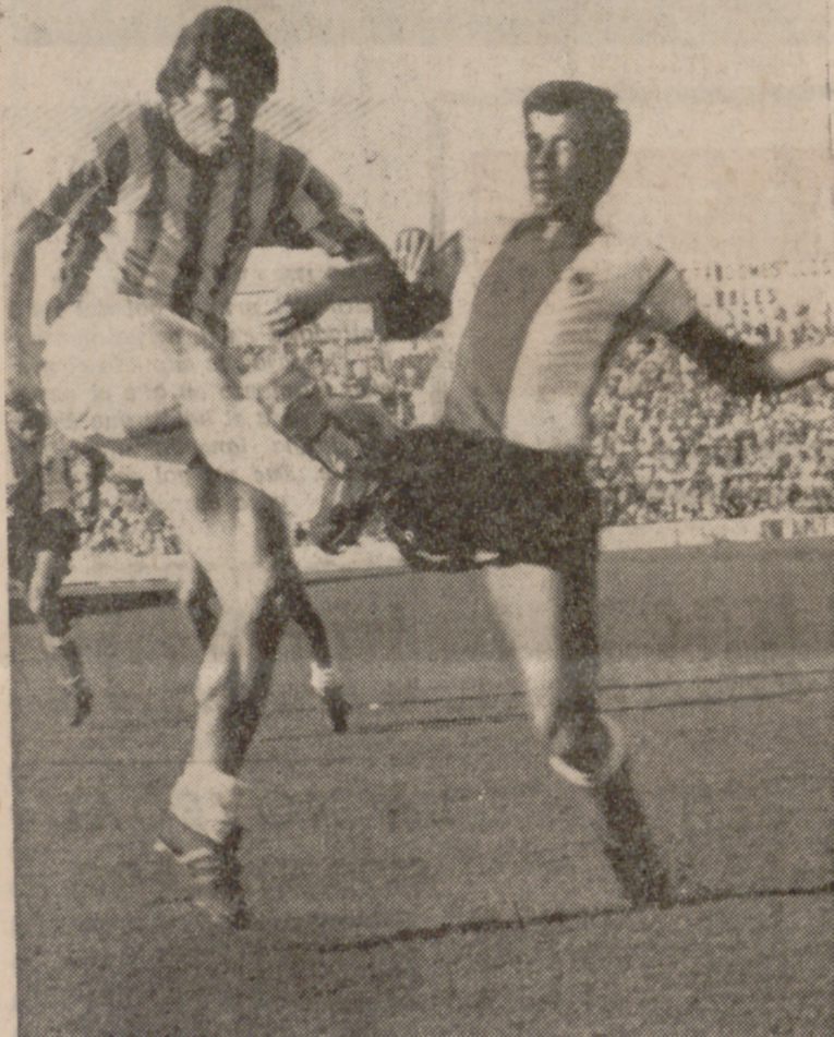
Alvarez prodigó ayer los remates y estuvo siempre en lucha con la zaga visitante.