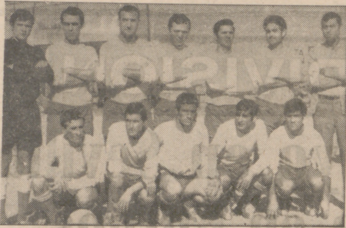
El G. E. Fasa, que ya es campeón del primer grupo.