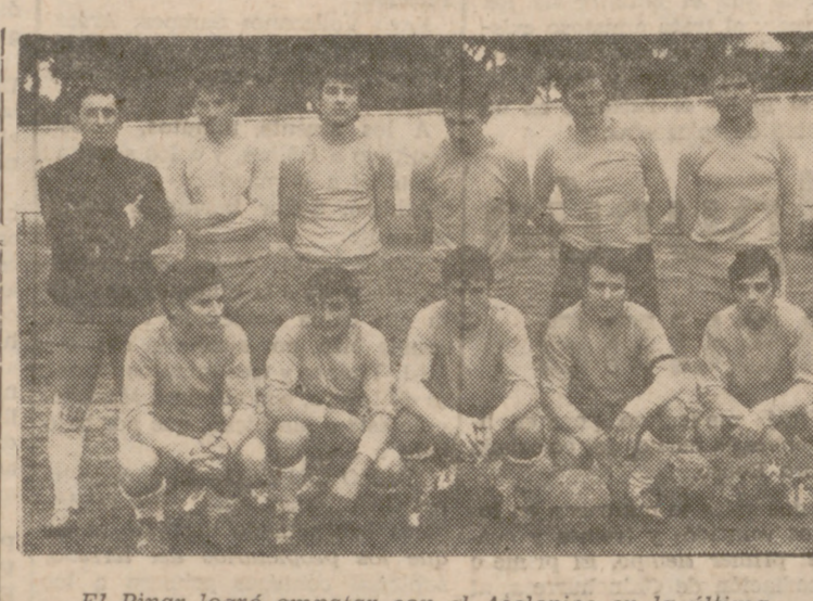
El Pinar logró empatar con el Asclepios en la última jornada del Campeonato.

El Pinar logró empatar con el Asclepios en la última jornada del Campeonato. El Pinar logró empatar con el Asclepios en la última jornada del Campeonato.