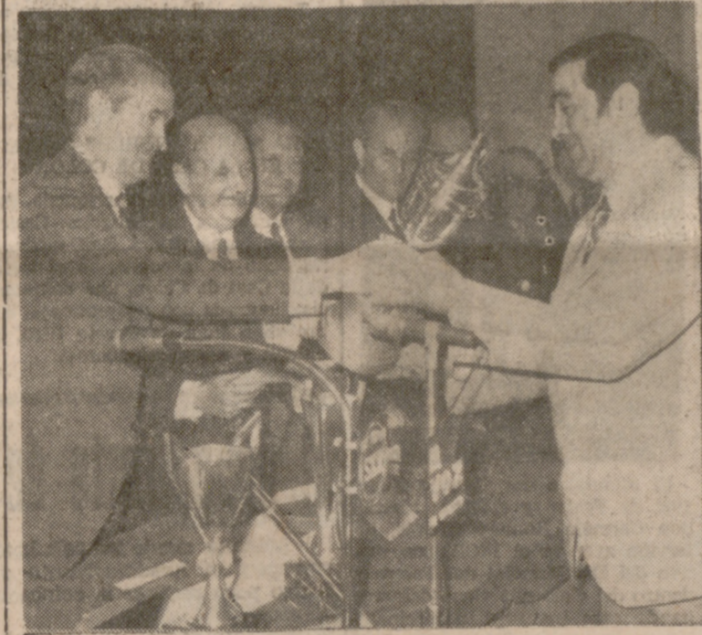
El Ministro de Industria, entregando uno de los premios del Concurso Nacional de Soldadura en Aluminio.

A la una y media de la tarde de ayer, el ministro de Industria, don José María López de Letona, después de girar visita a diversas factorías vallisoletanas, llegó a la Feria Regional de Muestras, recorriendo las instalaciones de la "EXPAL-71", interesándose por los productos expuestos. A continuación, en el Salón de Actos de la Feria, se celebró la clausura de las II Jornadas Nacionales del Aluminio. En la presidencia acompañaban al Ministro el General Gobernador Militar de Oviedo, en funciones de Capitán General; Gobernador Civil y Jefe Provincial del Movimiento, Presidente de la Audiencia Territorial, Rector de la Universidad, Presidente de la Diputación y de la "EXPAL-71", Alcalde, Presidente de la Cámara de Comercio y del Comité Ejecutivo de la Feria, Director General de Industrias Siderometalúrgicas, General Gobernador Militar de la plaza, General Jefe del Sector Aéreo y Dean de la Catedral en representación del señor Arzobispo.