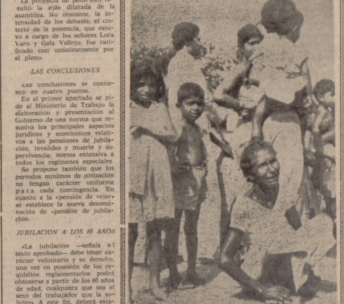
NOCHCHIYAGAMA (Ceilán).—Arrodillada, esta madre no puede contener su dolor por la muerte de su hijo a manos de los insurgentes ceilandeses. Según informes oficiales, los rebeldes realizan nuevos ataques, especialmente en las áreas norte y central del país.