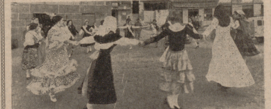
VIGO.—Se encuentran en esta ciudad las diecinueve majas españolas que mañana participarán en el concurso para la elección de "Maja de España 1971". Hasta tanto, las majas son agasajadas y su programa de visitas excursiones y recepciones es muy apretado. En la foto, las majas juegan al corro en la Ribera.