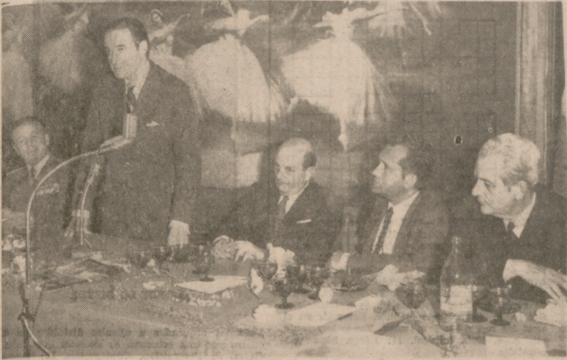
Don José María López de Letona, pronunciando unas palabras después del almuerzo.

A la una y media de la tarde de ayer, el ministro de Industria, don José María López de Letona, después de girar visita a diversas factorías vallisoletanas, llegó a la Feria Regional de Muestras, recorriendo las instalaciones de la "EXPAL-71", interesándose por los productos expuestos. A continuación, en el Salón de Actos de la Feria, se celebró la clausura de las II Jornadas Nacionales del Aluminio. En la presidencia acompañaban al Ministro el General Gobernador Militar de Oviedo, en funciones de Capitán General; Gobernador Civil y Jefe Provincial del Movimiento, Presidente de la Audiencia Territorial, Rector de la Universidad, Presidente de la Diputación y de la "EXPAL-71", Alcalde, Presidente de la Cámara de Comercio y del Comité Ejecutivo de la Feria, Director General de Industrias Siderometalúrgicas, General Gobernador Militar de la plaza, General Jefe del Sector Aéreo y Dean de la Catedral en representación del señor Arzobispo.